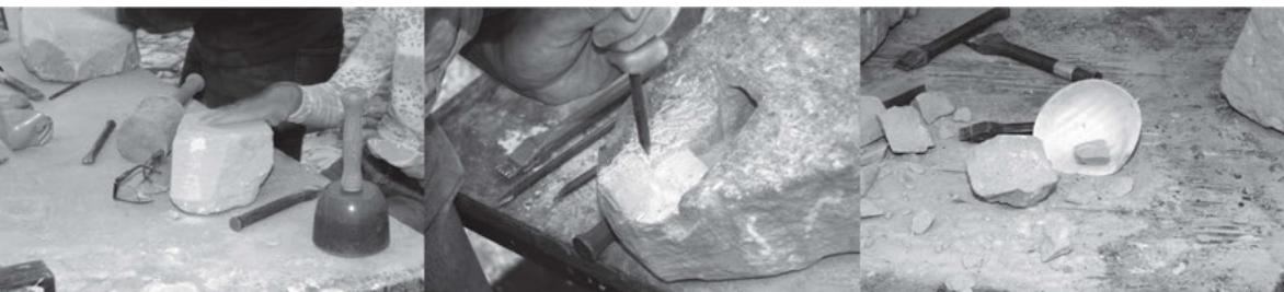
Plattform II