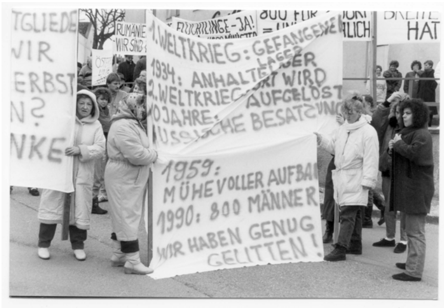
Abbildung 12: Demonstrationen gegen die Unterbringung von rumänischen Flüchtlingen in der Uchatius-Kaserne in Kaisersteinbruch, März 1990

ner:innen-Dorf einzuquartieren. Das Verteidigungsministerium sollte ab dem 5. März 1990 dem Innenministerium hierfür Teile der Kaserne und zur Unterbringung erforderliche Einrichtungsgegenstände bereitstellen. Die anfallenden Kosten wollte das Innenministerium dem Verteidigungsministerium mit 46 Schilling pro Tag und Flüchtling (rund 7 Euro) entgelten. Auch die Verpflegung und medizinische Versorgung sollte durch das Bundesheer erfolgen, wobei die hierfür anfallenden Kosten vom Innenministerium getragen wurden. Die Verwaltung und Kontrolle der Sicherheit des neu errichteten Lagers übernahm ebenfalls das Innenministerium. 195