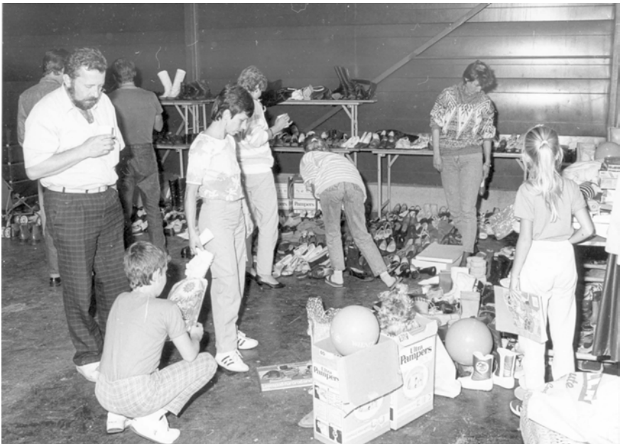
Abbildung 10: DDR-Bürger:innen beim Aussuchen von Schuhen, 1989 © Burgenländisches Landesarchiv, BF-Fotosammlung, Sign. 45BF.

halfen ehrenamtlich mit. 103 Unterstützung kam auch von anderen Organisationen wie der Caritas oder den Pfadfinder. Das österreichische Jugendrotkreuz stellte »Katastrophensackerln« unter anderem mit notwendigen Medikamenten zusammen. 104 Enge Abstimmung gab es zudem mit der Exekutive, auf deren Bitte das Rote Kreuz überhaupt erst aktiv wurde. Aufgrund der steigenden Zahlen an aufgegriffenen DDR-Flüchtlingen in Raum Mörbisch bat die lokale Polizei das ÖRK in Eisenstadt um Unterstützung bei der Versorgung der Flüchtlinge. Dies war und ist eine durchaus übliche Vorgangsweise, da das Rote Kreuz in der Regel auf Hilfsansuchen staatlicher Stellen aktiv wird. 105