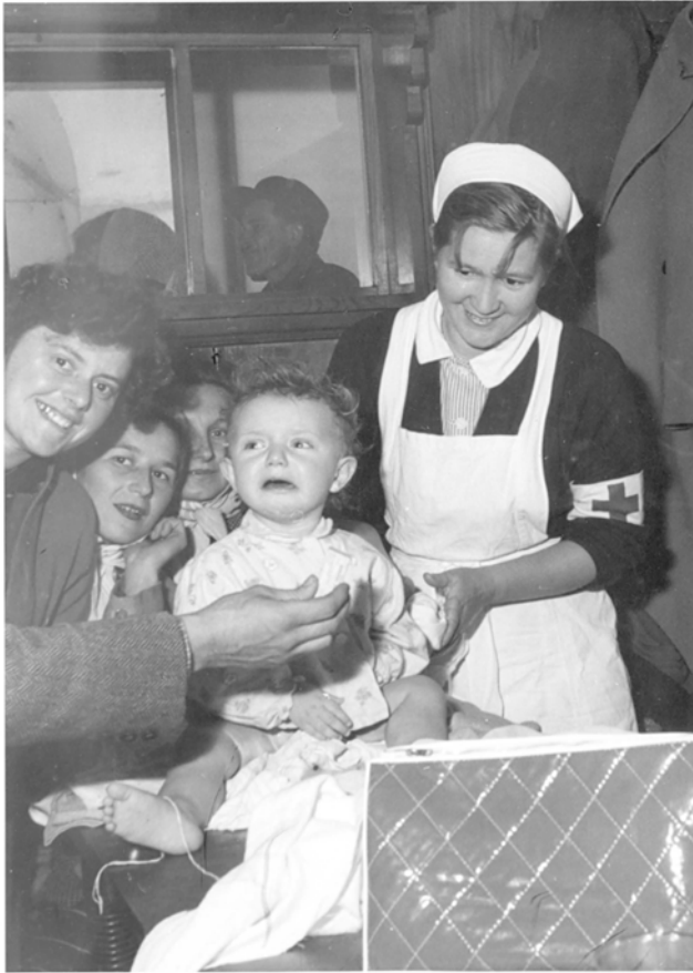
Abbildung 3: Eine Mitarbeiterin des Roten Kreuzes versorgt ungarische Flüchtlinge, 1956 © Burgenländisches Landesarchiv, Fotosammlung. Sign. 10120 LA.

Die Betreuung vor Ort, also in den Lagern der Liga selbst, übernahmen Mitarbeiter:innen von nationalen Rotkreuz-Organisationen aus aller Welt, was die Internationalität des Einsatzes unterstreicht. Insgesamt waren Teams aus 13 verschiedenen Ländern in den Flüchtlingslagern aktiv. Aus Europa waren das Rote Kreuz der Bundesrepublik Deutschland, Niederlande, Belgien, Lichtenstein, Norwegen, Finnland, Dänemark, Schweden, Großbritannien, Frankreich, Schweiz sowie Monaco aktiv. Aus Übersee wurde Personal aus Kanada und den USA geschickt. Insgesamt arbeiteten unter der Führung der Liga um die 650 Helfer:innen der internationalen Rotkreuzbewegung in Österreich. 214 Eine der aktivsten nationalen Organisationen war das ÖRK, das ohne konkrete