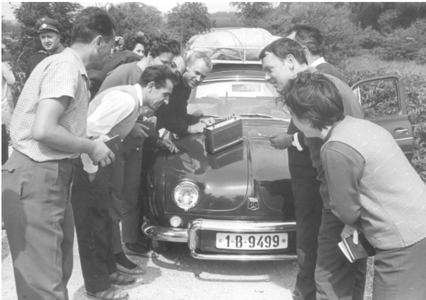
Abbildung 4: ČSSR Krise, Flüchtlinge hören die neuesten Nachrichten im Radio, 28. August 1968 © Votava/brandstaetter images/picturedesk.com, 19680828_PD0027 (RM).

In Spielfeld übernahm das ÖRK die Versorgung der Reiserückkehrer:innen. Das Generalsekretariat des ÖRK versetzte seine Mitarbeiter:innen und Landesverbände bereits am 21. August 1968 in Alarmbereitschaft, als die Nachrichten über den Einmarsch des Warschauer Pakts die Zentrale in Wien erreichten. Zwischen dem 26. August und 5. September 1968 richtete das Rote Kreuz am Grenzübergang Spielfeld eine Einsatzleitung (Meldekopf) ein, der die Reiserückkehrer:innen über die weiteren Möglichkeiten informierte und Situationsberichte an die Zentrale des Landesverbands in Graz weiterleitete. 42