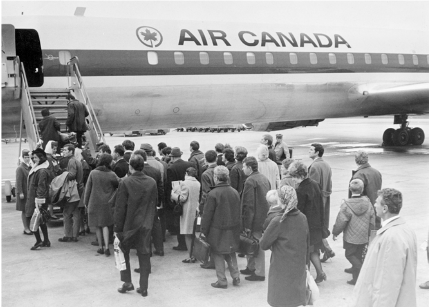
Abbildung 5: Abflug von tschechoslowakischen Staatsbürger:innen vom Flughafen Wien-Schwechat nach Kanada mit der Fluglinie Air Canada, 4. Oktober 1968 © Votava/brandstaetter images/picturedesk.com, 19681004_PD0020 (RM).

die Rückkehr ihrer Landsleute zu werben. 192 Die Bemühungen waren jedoch nicht unbedingt von Erfolg gekrönt. Insgesamt verließen geschätzt 100.000 Staatsbürger:innen bis Ende 1969 die Tschechoslowakei dauerhaft; nur ein Bruchteil, um die 3.723 Personen zwischen 1969 und 1970, kehrten wieder zurück. 193