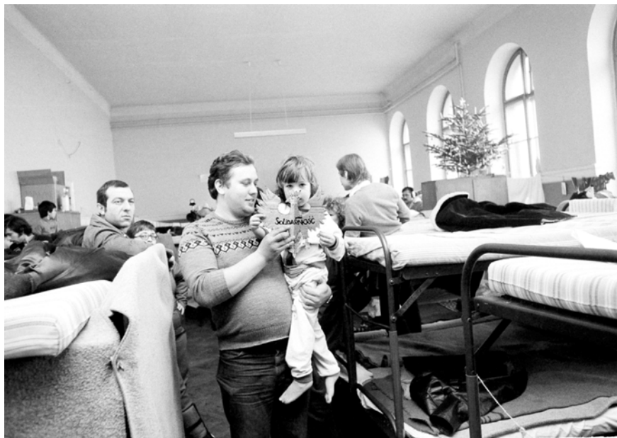
Abbildung 7: Ein polnischer Flüchtling hält seine Tochter und einen polnischen Adler mit einer Solidarnosc-Inschrift in die Höhe, Flüchtlingslager Traiskirchen, 31. Dezember 1981 © Werner Vollmann/AP/picturedesk.com, 19811231_PD0010 (RM).

Ein großer Teil der Kosten entfiel auf die Unterbringung. Polnische Asylwerber:innen wurden in den Flüchtlingslagern Traiskirchen, Mödling/Vorderbrühl, Reichenau/Rax, Bad Kreuzen, Lilienfeld, Thalham und in der Kaserne Götzendorf untergebracht. 32 Die Kaserne Götzendorf wurde hierzu im Juli 1981 vom Verteidigungsministerium dem Innenministerium zur Verfügung gestellt. 33 Die Kapazitäten dieser staatlichen Einrichtungen reichten jedoch bald nicht mehr aus und die Lager waren zusehends überfüllt. Insbesondere in Traiskirchen war die Unterbringung wegen der beengten Verhältnisse erneut prekär. 34 Zu einer deutlichen Aufstockungen der Kapazitäten in den bundeseigenen Flüchtlingsunterkünften, wie Traiskirchen, war es trotz der Erfahrungen, die das Land 1956 und 1968 gemacht hatte, nicht gekommen. 35 Darum ging das Innenministerium wie schon in den Fluchtbewegungen zuvor dazu über, Personen auch in Gasthöfen