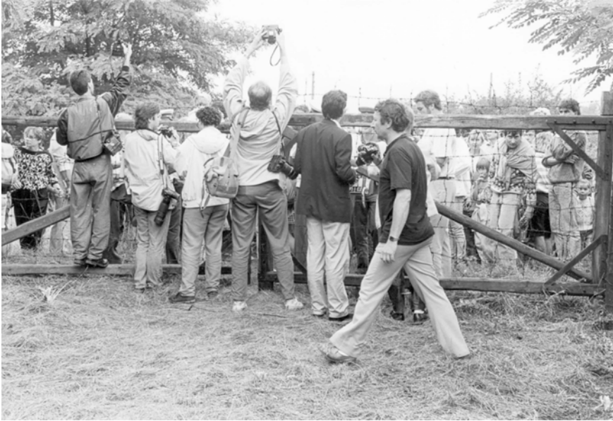
Abbildung 9: Flucht von DDR-Bürger:innen beim Grenztor zwischen Sankt Margarethen im Burgenland und Sopronkőhida in Ungarn im Rahmen des Paneuropäisches Picknicks, 19. August 1989

DDR-Flüchtlingen zugespielt wurden, um das Event zur Flucht zu nutzen. 60 Laut der burgenländischen Regionalzeitung BF-Die Burgenland Woche kursierten Gerüchte über die bevorstehende Grenzöffnung bei der Veranstaltung bereits seit Tagen, wenn nicht Wochen in der Grenzregion. 61