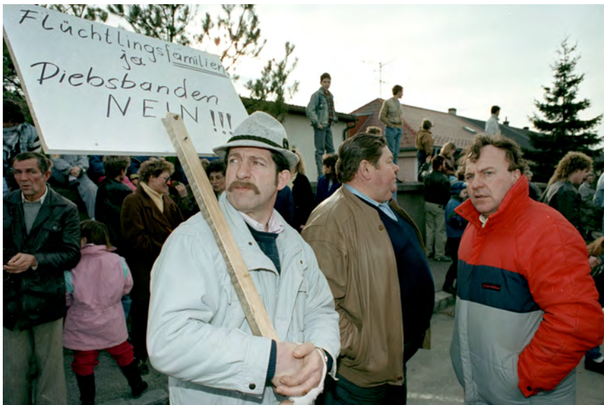
Abbildung 13: Demonstration gegen die Unterbringung rumänischer Asylwerber in Kaisersteinbruch, 6. März 1990 © Klaus Titzer/picturedesk.com, 19900306_PD0059 (RM).

Die Proteste führten bis nach Wien und vor das Innenministerium. 202 Am Höhepunkt der Kontroverse zwischen dem 6. und 8. März 1990 kam es gar zu einer Blockade der örtlichen Bundesstraße B10. 203 Die Verhandlungen über eine alle Seiten zufriedenstellende Lösung der Unterbringungsfrage führten schlussendlich vom burgenländischen Landeshauptmann Hans Sipötz (geb. 1941, SPÖ) über Innenminister Franz Löschnak (geb. 1940, SPÖ) bis zum Bundespräsidenten Kurt Waldheim persönlich. Eine Einigung konnte am 8. März 1990 erzielt werden. Das Innenministerium verzichtete auf die Unterbringung der Flüchtlinge in der Kaserne von Kaisersteinbruch. Die Bürgermeister der Gemeinden sollten sich im Gegenzug an der Suche nach geeigneten Unterkünften beteiligen. 204 Lokalen Medienberichten zur Folge geschah dies tatsächlich. Unter anderem nahm die Gemeinde Bruckneudorf 350 Flüchtlinge aus Rumänien auf. 205