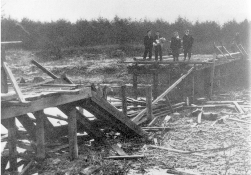
Abbildung 1: Andau, Ungarnflüchtlinge bei der zerstörten Brücke über den Einser-Kanal, 1956 © Burgenländisches Landesarchiv, Fotosammlung, Sign. 32818 LA.

Zum zentralen Fluchtpunkt entwickelte sich die kleine burgenländische Gemeinde Andau und der dort direkt an der Grenze verlaufende Einser Kanal. Für an die 70.000 Ungar:innen war die Brücke über den Kanal nach Andau der Weg in den »Westen«. Generell war das Gebiet östlich des Neusiedler Sees wegen seiner schilfbewachsenen Umgebung und der guten Erreichbarkeit aus zahlreichen ungarischen Städten ein wichtiger Fluchtraum. Die Brücke wurde am 21. November 1956 schließlich von der Roten Armee gesprengt. 16