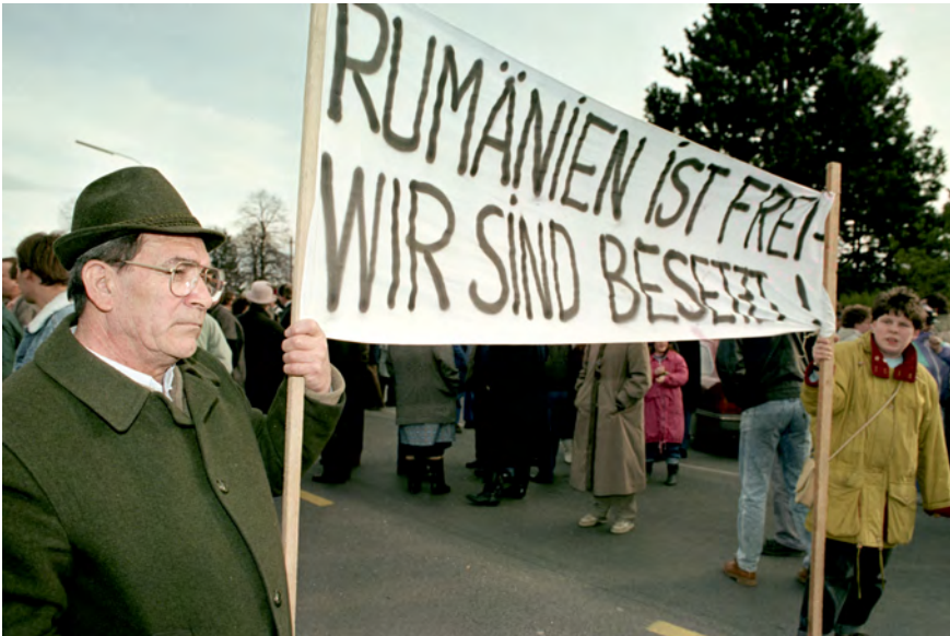
Abbildung 14: Demonstration gegen die Unterbringung rumänischer Asylwerber in Kaisersteinbruch, 6. März 1990 © Klaus Titzer/picturedesk.com, 19900306_PDO065 (RM).

Überbelegung des dortigen Flüchtlingslagers demonstriert. 206 In Kaiserebersdorf war es die Nachbarschaft, die gegen die Nutzung einer alten Schule als Notaufnahmelager protestierte. Auch hier wurde Innenminister Löschnak mangelnde Sensibilität im Umgang mit den Anrainern vorgeworfen. Kritisiert wurde, dass die Nachbarschaft der Schule nicht in den Entscheidungsprozess einbezogen, sondern vor vollendete Tatsachen gestellt wurde. Die Betreuung der Asylwerber:innen übernahm in dieser Unterkunft die Caritas im Auftrag der Gemeinde Wien. 207