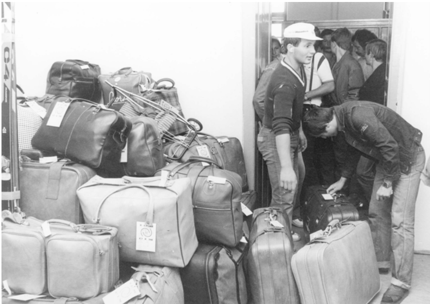
Abbildung 8: Reisevorbereitungen von polnischen Flüchtlingen im Flüchtlingslager Traiskirchen für ihre Abreise nach New York, 18. August 1981 © Votava/brandstaetter images/picturedesk.com, 19810818_PD0022 (RM).

auf 9.000 Personen fest. 83 Kanada erweiterte seine Quoten für osteuropäische Zuwander:innen von 4.000 auf 5.000 Plätze und sagte für 1982 ein Kontingent von 6.000 Personen zu. 84 Australien nahm 1981 2.241 Asylwerber:innen aus Österreich auf, was ein etwas geringerer Wert als im Jahr zuvor war, als 2.272 Personen hier Aufnahme fanden. 85 Neuseeland ermöglichte 1981 die Weiterreise für 100 Flüchtlinge aus Osteuropa. 86 Schweden, Dänemark und Norwegen übernahmen jeweils 25 »handicapped« Asylwerber:innen. 87 Insgesamt, von allen sich in Österreich aufhaltenden Asylwerber:innen, reisten 1981 9.072 Personen aus Österreich weiter; 1980 waren es noch 5 424 gewesen. 88