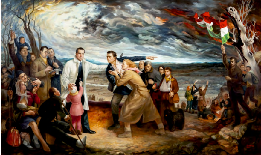
Abbildung 2: Nixon at Andau by Frederic Daday © Courtesy of the Richard Nixon Foundation.

Ort ein Bild von der Lage der ungarischen Flüchtlinge machen. Der Besuch wurde von dem Maler Ferenc Daday bildgewaltig festgehalten. 19