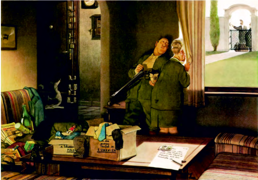
Abbildung 11: »An die armen Teufel in Rumänien: [...] aber kaufts Euch nicht wieder Alkohol od. Zigaretten, auch keine Pornoheftln [...]«, Karikatur zum Artikel »Flüchtlinge. Kein Land in Sicht«, in: Profil Nr. 12, 19. März 1990, S. 16f. © Gerhard Haderer; mit freundlicher Erlaubnis.

betonte und worüber in der SPÖ–ÖVP Koalition Einigkeit herrschte. 187 Zudem intensivierte sich Sicherheitsdiskussionen um rumänische Staatsbürger:innen in Österreich. Sie standen im Generalverdacht »Kriminelle«, »Sozialschmarotzer«, »potenzielle Triebtäter« oder Agenten des berüchtigten rumänischen Geheimdiensts Securitate zu sein. 188