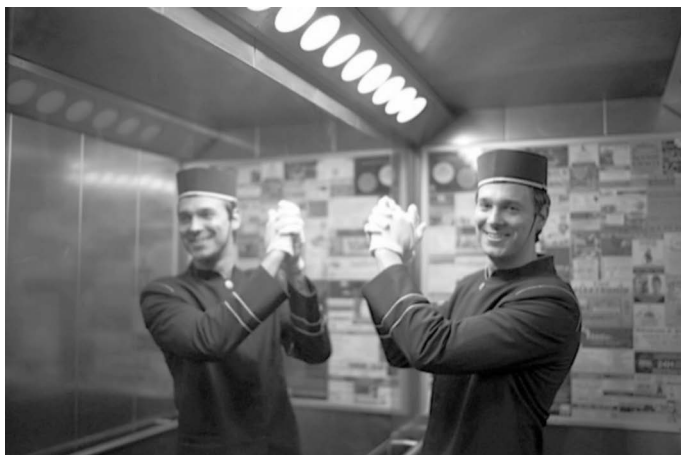
9 Im Aufzug.

Für die Bereitstellung der Pagenuniform gilt mein aufrichtiger Dank dem Hotel Adlon!