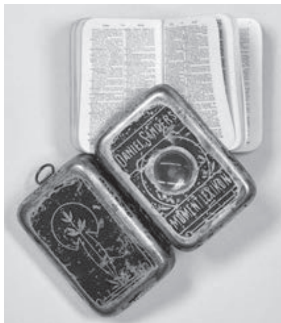
Abb. 4: Ein Kuriosum – ein winziges Lexikon als echtes Taschenbuch. Daniel Sanders' Moment-Lexikon und Fremdwörterbuch . Berlin: Steinitz, [ca. 1904] in der SBB-PK Berlin