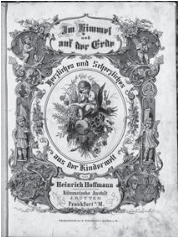
Abb. 3: Der Verfasser ist bekannt geworden durch den »Struwelpeter«. Heinrich Hoffmann: Im Himmel und auf der Erde: Herzliches und Scherzliches aus der Kinderwelt . Frankfurt a. M.: Literarische Anst. J. Rütten, [1857] in der UB Frankfurt