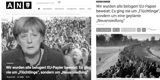
Abb. 26 & 27: Zwei vergleichbare Bild-Text-Kombinationen einer Desinformation 147

denen Kontroversen. Diese Desinformation eignet sich daher, um die für die nachfolgenden Untersuchungen grundlegenden Erkenntnisse zu skizzieren.