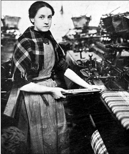
Abbildung 5: Arbeiterin in einer Fabrik in Manchester (um 1900)