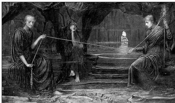
Abbildung 2: John Strudwick: A Golden Thread (Öl auf Leinwand, 1885), Tate Gallery, London

Da gab es in der antiken Tradition zum Beispiel das Spinnen, das hier keine einfache Tätigkeit war, sondern Kunst. Die Moiren – Klotho, Lachesis und Atropos – waren drei Schwestern und die Töchter von Zeus. Ihnen war es überlassen, die Lebensspanne eines Menschen zu bestimmen, indem sie dessen ›Schicksalsfaden‹ (Lebensdauer) spinnen, bemaßen und abschnitten (vgl. Abb. 2). Die klassische Mythologie berichtet auch von Ariadne auf Kreta, die sich in Theseus