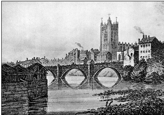
Abbildung 3: Manchester im 19. Jahrhundert Old Church and Bridge from Blackfriars

»Ich erinnere mich an das erste Mal, als ich Manchester sah«, schreibt ein Reisender, William Cooke Taylor, 1842. »Ich sah einen Wald von Kaminen, die Wolken von Dampf und Rauch abgaben; der wiederum ein tintenhaftes Dach bildete, das den ganzen Ort beherrschte und dem man nicht enttrinnen konnte.« (Taylor 2 1842) Mitte des 19. Jahrhunderts entwickelte sich Manchester tatsächlich von einer kleinen Küstenstadt des Westens Großbritanniens zu einer geschäftigen Industriestadt voller Fabriken und Textilunternehmen. Große Teile