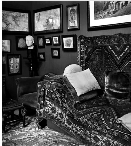
Abbildung 10: Freuds Couch (1939)

Vielleicht sollen wir nicht vergessen, dass uns Freud mit der Erfindung der Psychoanalyse und der Etablierung der psychoanalytischen Therapie seine eigene Geschichte der Philomena offeriert. Als umtriebiger Sammler von antiken Objekten interessierte sich Freud keineswegs nur für ägyptische, griechische oder römische Statuen, die auf seinem Schreibtisch oder in Glasschränken aufbewahrt wurden. Er liebte auch Webprodukte, besonders Teppiche. Einer seiner meistgeschätzten Besitztümer war eine Textile aus Persien: ein Qashqai-Ser-