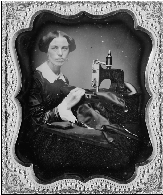
Abbildung 1: Die Näherin (Daguerreotype, ca. 1853). Eines der frühesten amerikanischen Bilder einer Frau mit einer Nähmaschine, hier einer industriellen Nähmaschine von Grover & Baker.

1830 wurde die Nähmaschine von Barthelemy Thimonnier erfunden und in den folgenden Jahrzehnten von Elias Howe und Isaac Singer weiterentwickelt. So entstanden maschinenbestückte Nähstuben und das Nähen als häusliche Handarbeit rückte in die Kategorie einer Luxusbeschäftigung. Genau wie das ornamentale Sticken, das einst zu einer Tätigkeit aristokratischer Frauen zählte, war nun das Stricken und das Nähen mit der Hand nicht einfach eine Beschäftigung für Frauen, sondern eine Freizeitbeschäftigung für jene Frauen, die es sich leisten konnten, Freizeit zu haben. Die Nähmaschine als Erfindung des industriell-