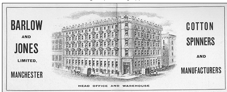
Abbildung 4: Anzeige Barlow & Jones Ltd, Manchester Bilder des Büros und Warenlagers (März 1907)