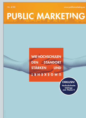
Das Magazin für Kommunikation im öffentlichen Sektor www.publicmarketing.eu