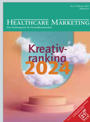
Das Fachmagazin für Pharma-Marketing www.healthcaremarketing.eu