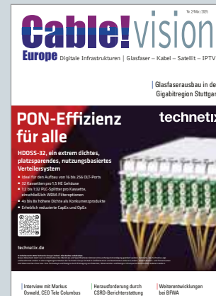
Das Fachmagazin für Kabel, Satellit, Breitband und Digital-TV www.cablevision-europe.de