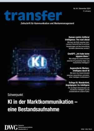
Das Magazin für Kommunikation und Markenmanagement www.transfer-zeitschrift.net