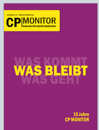
Das Magazin für Content Marketing www.cp-monitor.de