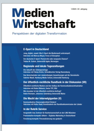
Das Fachmagazin für Medienmanagement und -ökonomie www.medienwirtschaft-online.de