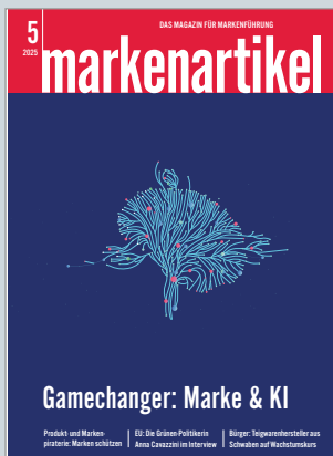
Das Magazin für Markenführung www.markenartikel-magazin.de