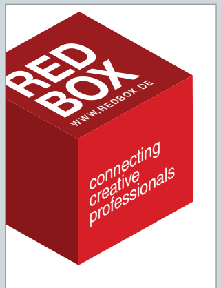
Connecting Creative Professionals www.redbox.de