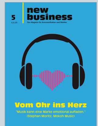
Das Magazin für Kommunikation und Medien www.new-business.de