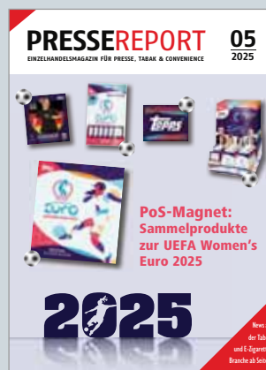
Das Fachmagazin für Presse, Tabak und Convenience www.presse-report.de