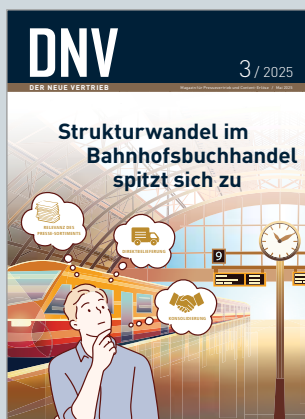
Das Magazin für Pressevertrieb und Content-Erlöse www.dnv-online.net