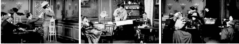
Abb. 1-3 Screenshots aus LES RÉSULTAT DU FÉMINISME (weiblicher Körperstil, Haushalt, Männer im Café)

ihre Macht zurück. 13 Auf der Folie von Judith Butlers Unterscheidung von der affirmativen Parodie zur subversiven Pastiche kann dem Film dennoch ein subversives Potenzial zugeschrieben werden, schließlich offenbart er die »Imitationsstruktur der Geschlechteridentität«, 14 indem er zeigt, dass Weiblichkeit und Männlichkeit Körperstile sind, die mit Machtpositionen einhergehen und die in der Not mit Gewalt zurückerobert werden ›müssen‹.