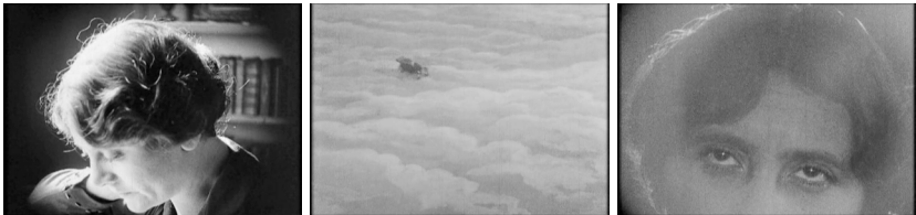
Abb. 9-11 Die subjektive Kamera – Mme Beudets Tagträume. Screenshot aus LA SOURIANTE MME BEUDET

Kurz vor der Mitte des Films – inszeniert sozusagen als Höhepunkt bürgerlicher Dumpfheit – liest Mme Beudet das Gedicht La Mort des amants aus den Fleurs du Mal (1857) von Charles Baudelaire. Die Zuschauer*innen lesen mit ihr die ersten Verse: »Nous aurons des lits pleins d'odeurs légères,/Des divans profonds comme des tombeaux,/Et d'étranges fleurs sur des étagères«. Das Pathos Baudelaires wird in LA SOURIANTE MME BEUDET Vers für Vers mit statischen Einstellungen aus ihrem Haushalt banalisiert. Mit den jeweils eingblendeten Versen interagiert ein unbenutztes Bett, zwei hübsch arrangierte Kissen im Sessel und die von den Eheleuten immer wieder auf den vermeintlich richtigen Platz geschobene Vase mit künstlichen Blumen. Am Ende wirft Mme Beudet resigniert das Buch zu Boden. Offensichtlich ist auch ein anderer Prätext, nämlich Flauberts bürgerliche Epopöe Madame Bovary. Mœurs de Province (1856), der schon mit der erste Zwischentafel (»En province«) markiert wird. 26 Der bovarysme der Mme Beudet wird allerdings nicht durch romantische Literatur ausgelöst, sondern durch eine Illustrierte, ein augenzwinkernder Hinweis auf die wachsende Bedeutung dieses Mediums in den 1920er Jahren und auch darauf, dass die Protagonistin als moderne Frau zu verstehen sei, die als mediales Idealbild eben in diesen Illustrierten und anderen visuellen Medien gezeigt wird.