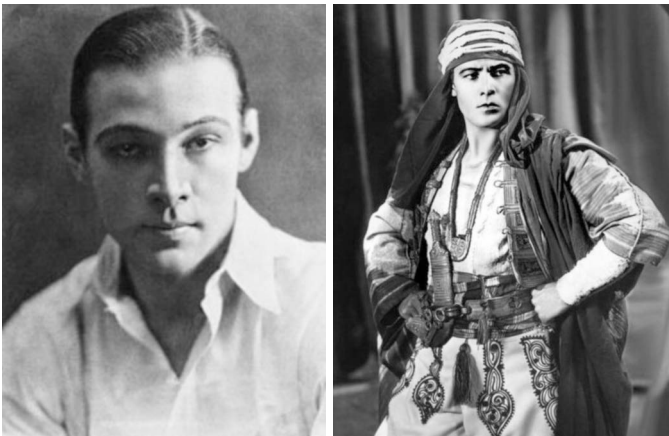
Abb. 19 u. 20 Rodolfo Valentino (Autogrammkarte und Screenshot aus seinem Kassenschlager THE SHEIKH (USA 1921, Melford)

scheinbar ebenfalls in Aufbruchstimmung ist (Abb. 24-26). Sie zeigt sie uns auktorial, aber auch unsere Protagonistin beobachtet sie – wenn auch sehr verhalten. Mit anderen Worten: Die Kamera zeigt queere Menschen und queere Blicke und,