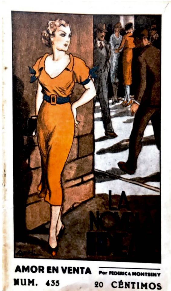
Abb. 1 Cover von Amor en venta (Federica Montseny, 1934)

ne sterile Beschreibung des Geruchs nach Laugenwasser, der glänzenden Fliesen sowie der jungen Frauen, die sich in ihren Zimmern fertigmachen. Ähnlich der Frau auf dem Cover, die modern und vital erscheint, werden die Bewohnerinnen als »pupilas« vorgestellt, wodurch ihre Jugendlichkeit unterstrichen wird. Ursula hingegen ist ausgelaugt und entmutigt und übernimmt gewissermaßen eine didaktische Warnfunktion, um der nachkommenden Generation aufzuzeigen, welche Gefahren mit der Figur der »modernen Frau« verbunden sind. Parallel dazu wird das Bediensteten-Dasein der Frauen akzentuiert, wiederum konkret im Bor-