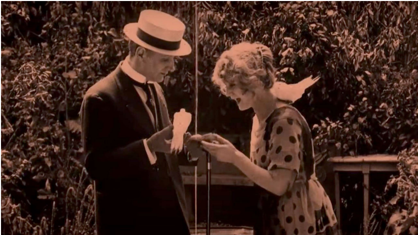
Abb. 8 Gegensatz im Bild. Screenshot aus LA CIGARETTE.

so kein männlich hegemonialer, abtastender Blick à la klassisches Hollywoodkino, die Kamera schaut vielmehr näher hin und bewegt sich auf Augenhöhe mit einer selbstbewussten Frau; alles andere wird im wahrsten Sinne des Wortes ausgeblendet (Abb. 7). Dulac arbeitet hier mit einer nicht zentrierten Kreisblende. Das rechteckige Filmbild wird auf einen kreisförmigen Ausschnitt verengt, als würden wir uns dem Dargestellten beispielsweise mit einem Teleskop nähern, um Nicht-Sichtbares sichtbar zu machen. Die Kreisblende dient dazu, Blicke in ›andere Welten‹ zu ermöglichen, so konnte das technische Wunderwerk des Films und die