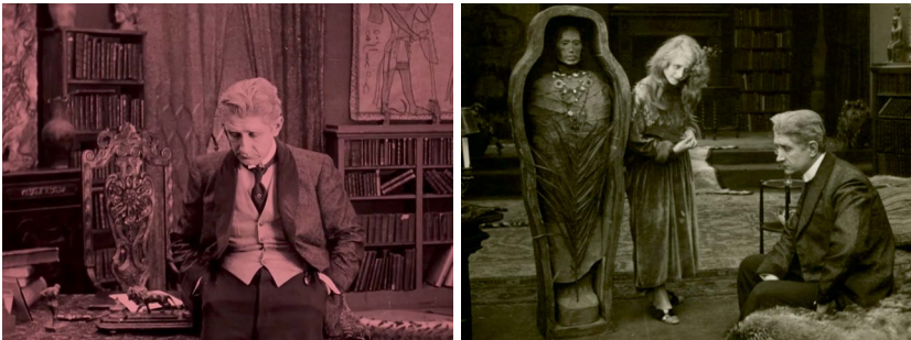
Abb. 4 u. 5 Geschlossene Kadrierungen und die Mumie im Schlafzimmer. Screenshot aus LA CIGARETTE

Der Film beginnt ungewöhnlicher Weise in medias res , der establishing shot mit einer Standkamera zeigt das Museum als Pierres Wirkungsstätte als Ägyptologe und später sehen wir sein Arbeitszimmer; offensichtlich wird, wie sehr der Mitfünfziger in vergangenen Zeiten lebt. Dulac inszeniert die überladenen, holzverkleideten Räume mit geschlossenen Kadrierungen – ein Außerhalb existiert quasi nicht (Abb. 4). In dieser ersten Szene wird zwischen den antiken Statuen die Mumie einer Prinzessin ins Museum gebracht. Die ägyptische Prinzessin wird von Pierre in einer seiner Studien explizit als zu lebenslustig, zu flirtend und zu frivol charakterisiert, so dass sie ihren viel älteren Ehemann einst zur Verzweiflung trieb, der sich infolgedessen mit einem vergifteten Kuchen das Leben nahm. Für gewisse Zeit wird die Mumie zur ›Partnerin‹ Pierres, da er sie direkt mit ins Schlafzimmer nimmt. In dem Spiel mit dem Tod liegt nicht zuletzt die morbide Komik des Films wie sie narrativ aber auch visuell durch die physische Nähe der beiden Frauen dargestellt wird hervorgebracht wird (Abb. 5).