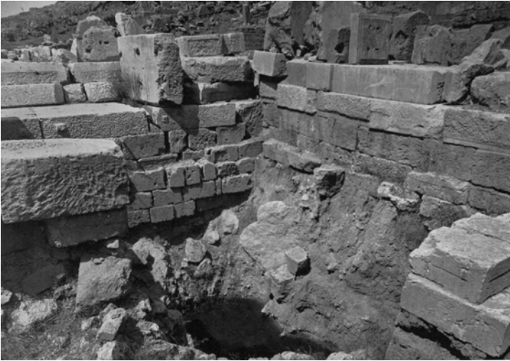
Abb. 2: Obwohl sie im Adyton bis auf den anstehenden Fels hinabgruben, konnten die Archäologen der Grande fouille keine Hinweise auf eine Erdspalte finden

Auch Plutarch, als delphischer Priester des zweiten Jahrhunderts nach Christus bestens mit dem Orakel vertraut, führt die Wahrsagungen auf das ›enthusiastikon pneuma‹ zurück. In einem der von ihm verfassten Dialoge geht er aber noch darüber hinaus und zeigt, wie es ein Teil des Lebens in Delphi ist, sich intellektuell mit der Funktionsweise des Orakels auseinanderzusetzen und Hypothesen zu bilden, wie es zu dem Dunst kommt. So argumentiert einer der Gesprächsteilnehmer ausführlich, dass halbgöttliche Dämonen für die Regulierung des Pneumas und damit den reibungslosen Ablauf verantwortlich seien; andererseits entwickelt er aber auf Basis der aristotelischen Philosophie auch ein Erklärungsmodell für seine Entstehung: Er bezeichnet das Pneuma als ›anathymiasis‹, Ausdünstung. Aristoteles hatte diesen Terminus und das damit verbundene Konzept dazu genutzt, die Entstehung von Erdbeben zu erklären. Würde Sonne auf die Erde scheinen, verdunste die darin enthaltene Feuchtigkeit, und die so entstehenden unterirdischen Winde seien für die Erschütterungen verantwortlich. 16 Genauso beschreibt Plutarchs Sprecher, wie durch das Zusammenwirken von Erde und Sonne das enthusiastische Pneuma entsteht – und findet damit eine naturphilosophische Erklärung dafür, wie das Zusammenspiel von Erdgöttin Gaia und Sonnengott Apoll für die Sehergabe der Pythia verantwortlich ist. 17