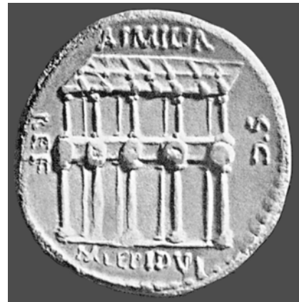
Abb. 2: Fünf Jahre früher hatte M. Aemilius Lepidus die von seiner Familie 179 vor Christus errichtete Basilica Aemilia auf seine Denare geprägt

Die bislang archäologisch nicht nachweisbare Villa Publica, ein Versammlungsort aus dem ersten Jahrhundert der Römischen Republik, hatte wohl 194 vor Christus die