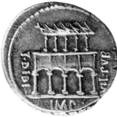
Abb. 1: Denare des P. Fonteius Capito erinnerten 56 vor Christus an eine Sanierung der Villa Publica, die T. Didius zu Beginn des Jahrhunderts finanziert hatte

Eines heißen Sommertages um die Mitte des ersten Jahrhunderts vor Christus sitzt der angesehene Augur Appius Claudius Pulcher im Gebäude der Villa Publica auf dem südlichen Marsfeld in Rom. 3 Er hat sich heute hier positioniert, weil ganz in der Nähe die Aedilen gewählt werden: Bei einem solch wichtigen Staatsakt kann es jederzeit vorkommen, dass spontan die Götter befragt oder die Flugbahnen eines vorbeikommenden Vogels interpretiert werden müssen. Um den Vogeldeuter haben sich, so will es der Autor, mehrere Standesgenossen geschart, welche die Beinamen Merula, Pavo, Pica und Passer tragen – zu Deutsch Amsel, Pfau, Elster und Sperling. 4