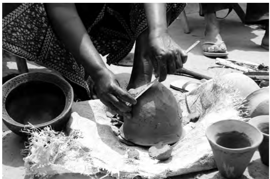
Fig. 9 : Raclage du fond et de la panse du récipient à l'aide d'un rachis de feuille de palmier ( lúbàsà ).