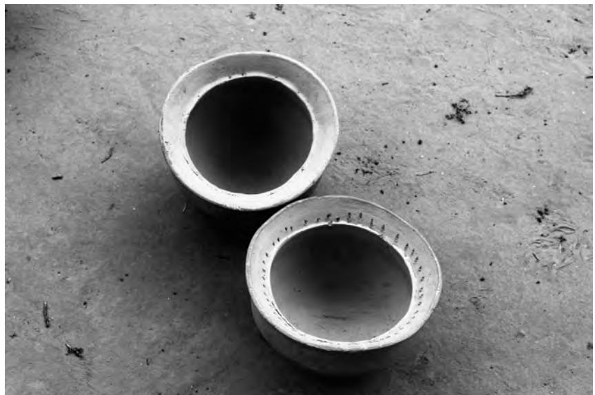
Fig. 8 : Poteries décorées mises à sécher.