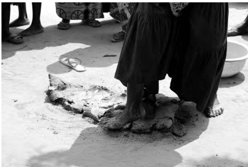
Fig. 2 : Pétrissage de la pâte par piétinement ( kúdiàtà ).

s'était établi le premier village de Nsangi-Binsu, celui des ancêtres, ce qui explique aussi l'attachement à ce lieu.