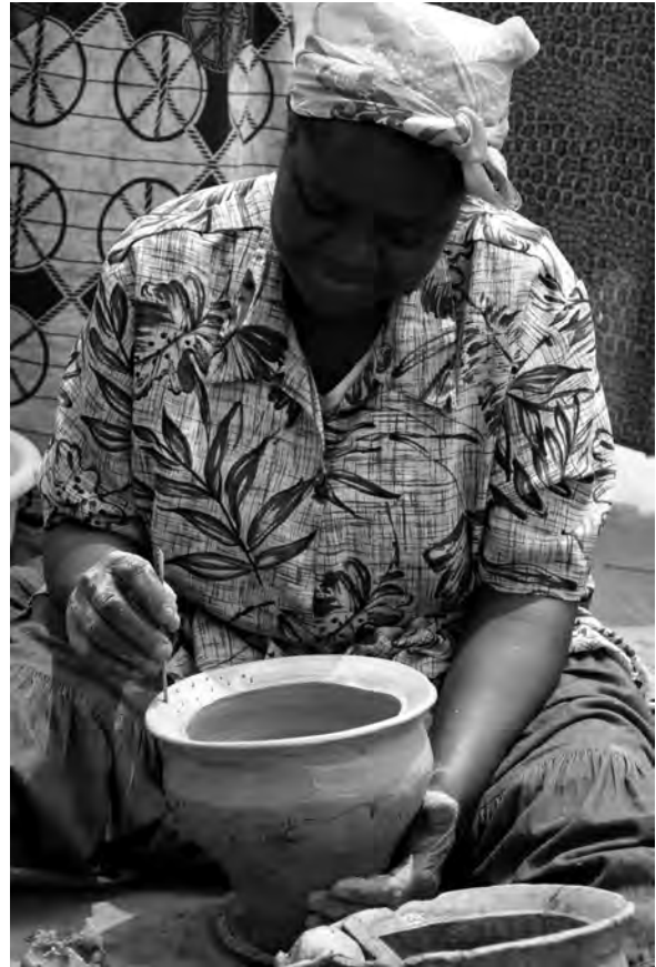
Fig. 7 : Décoration de l'ébauche.

col à l'aide d'un bâtonnet et/ou d'un peigne à plusieurs dents ( nwátúnù ), des outils fabriqués par la potière. Le décor est appliqué sur une pâte relativement molle, c'est-à-dire avant le séchage proprement dit. Le décor réalisé de traits, de pointillés et de formes géométriques ne signifie rien en particulier, d'après la potière (Fig. 7). Il est uniquement appliqué pour des fins d'esthétique.