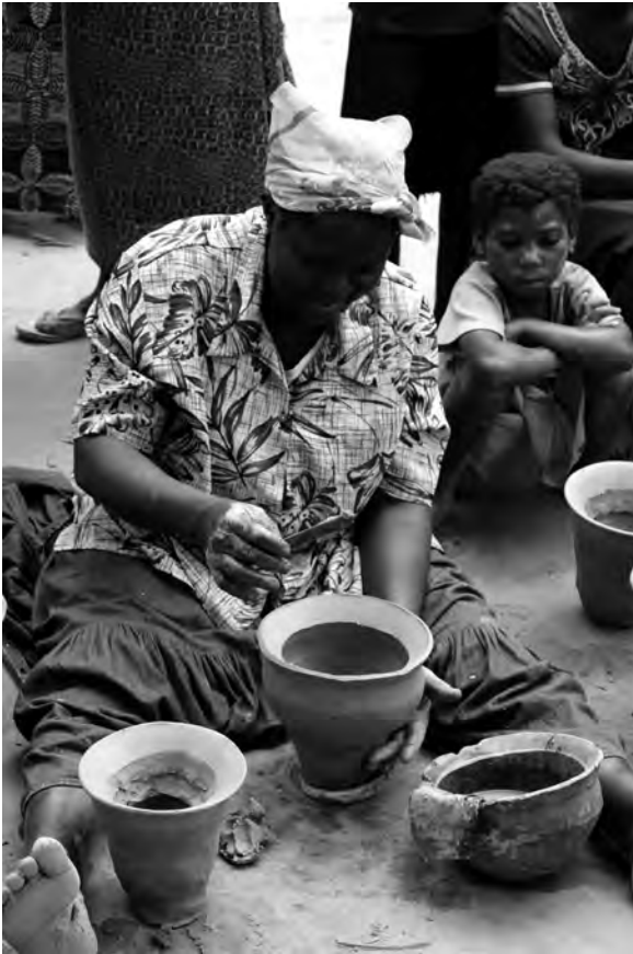
Fig. 6 : Mise en forme (étirement du col).