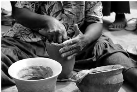
Fig. 4 : Adjonction de colombins.

Au total deux ou trois colombins, dont le dernier plus fin que les premiers, sont utilisés pour monter l'épaule et le col du récipient. Elle procède ensuite à la mise en forme du récipient qui se fait en différentes étapes : lissage du sommet du récipient ( kuúkùlà ) à l'aide d'un morceau de tissu humide ( nsándálà ) placé à cheval sur le sommet de l'ébauche (Fig. 5). Elle utilise ensuite un rachis de feuille de palmier ( lùbàsá ) pour former le col ( bèndùlù nkúúlù ), déplaçant ainsi un peu de matière sans en retirer (Fig. 6). Le geste consiste à appliquer une petite pression sur quelques centimètres sur la partie supérieure de l'ébauche vers l'extérieur puis à lisser à nouveau avec le morceau de tissu suivant le procédé évoqué supra.