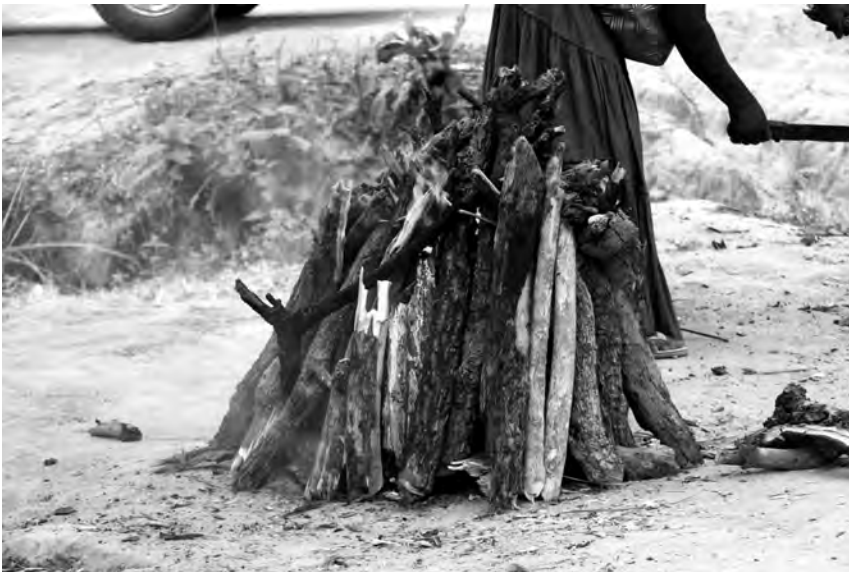
Fig. 10 : Cuisson des récipients.

On en retrouve également des empreintes flagrantes dans les assemblages céramiques des sites archéologiques de Ngongo-Mbata dans une couche d'habitation datée de la deuxième moitié du 17 e siècle (Clist et al. 2015), des sites de Lemfu et de Kindoki dans une couche d'habitation plus récente datée du courant du 19 e siècle (Clist et al. 2013) ainsi que sur une série de poteries kongo de la collection du Musée Royal de l'Afrique Centrale à Tervuren produite au courant de la deuxième moitié du 19 e siècle.