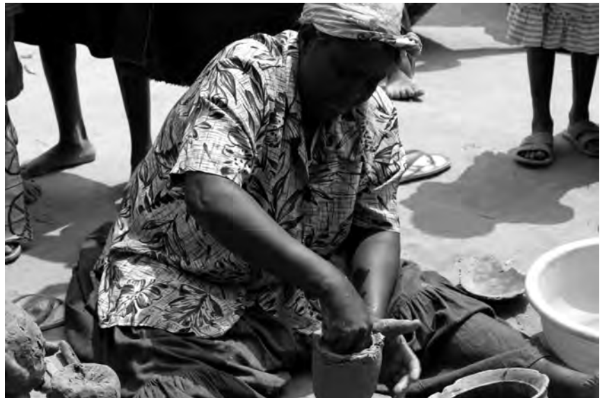
Fig. 3 : Le début de l'ébauche.