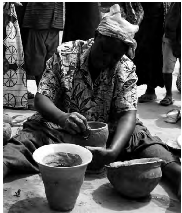
Fig. 5 : Lissage du sommet de l'ébauche.

Elle intervient après un séchage qui aura duré environ une demi-heure. Le décor appliqué sur ces récipients est composé d'éléments imprimés et incisés. Il est placé sur l'épaule et sur la surface interne du