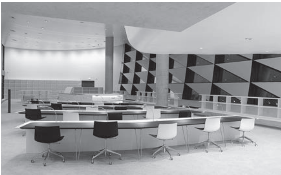
Abb. 3: Museumslesesaal