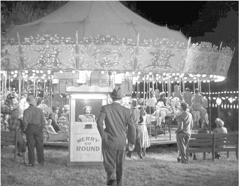
Szenenfoto aus: Alfred Hitchcock: DER FREMDE IM ZUG (1951)