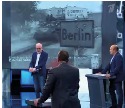
Abbildung 3: Die Erinnerung an den Sieg über die deutschen Faschisten im Zweiten Weltkrieg ist im russischen Fernsehen allgegenwärtig. 33

Die Erinnerung an den Zweiten Weltkrieg soll zum erneuten Kampf mobilisieren, dient aber auch dazu, Russland als erneutes Opfer des Faschismus zu präsentieren. In der Talk Show „Wremja Wspomnit“ (Zeit sich zu erinnern) beim Perwyj Kanal , dem größten TV-Sender Russlands, zeigte Moderator Aleksandr Gordon ein Video über die Siegesfeier im besiegten Berlin von 1945. „Es schien, dass sie es nie vergessen werden“, sagt er, aber dann präsentiert er die Reaktionen Lettlands auf den Krieg in der Ukraine wie die Einordnung Russlands als „Staat, der Terror unterstützt“. 34 Auch Beschränkungen Lettlands für die Einreise von russischen Staatsbürgern und den Gebrauch der russischen Sprache werden diskutiert. Gordon sieht die Russen als Opfer eines neuen Faschismus, wenn er fragt: „Im 21. Jahrhundert haben die Russen die Rolle der Juden übernommen, ist es so oder nicht?“ Im Verlauf der Sendung gibt Gordon selbst die Antwort: „Was hat sich geändert in dem Bewusstsein der Letten, die jetzt nach ethnischen Kriterien de facto eine Form des Genozids vollziehen?“ 35