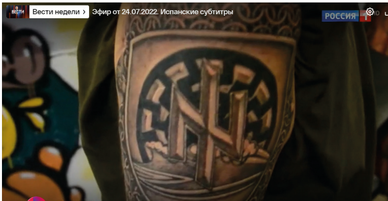
Abbildung 1: Ein Bericht über ukrainische Neonazis in den „Nachrichten der Woche“. 20

Der Kampf mit den ukrainischen Faschisten steht im Fokus der politischen Sendungen, wie hier die „Nachrichten der Woche“. Gezeigt werden glatzköpfige Männer mit nacktem Oberkörper, die sich Nazi-Symbole wie die Wolfsangel in die Haut tätowieren lassen. Anschließend werden ihre mutmaßlichen Foltermethoden detailliert geschildert. 21