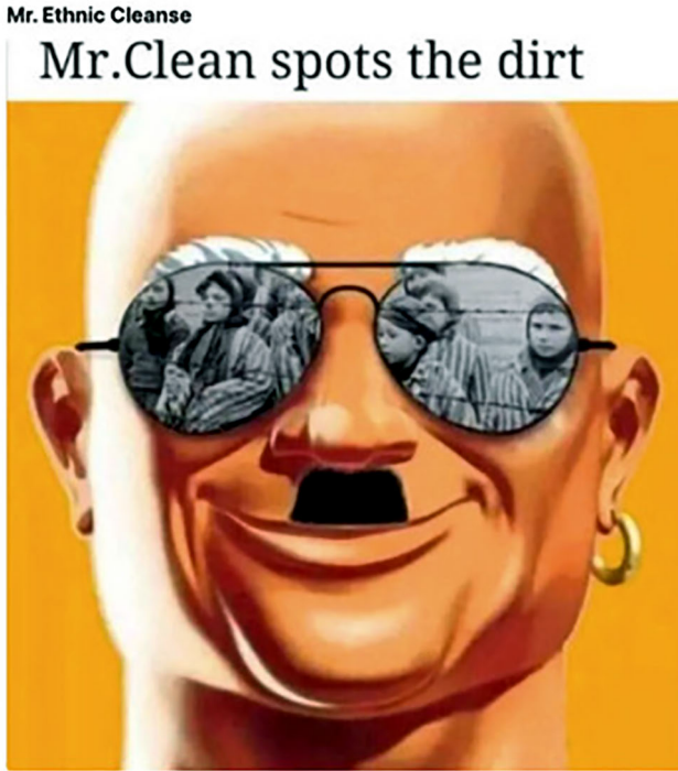
Abbildung 4: Holocaustverherrlichender Medientransfer in ›Mr Clean‹-Meme II