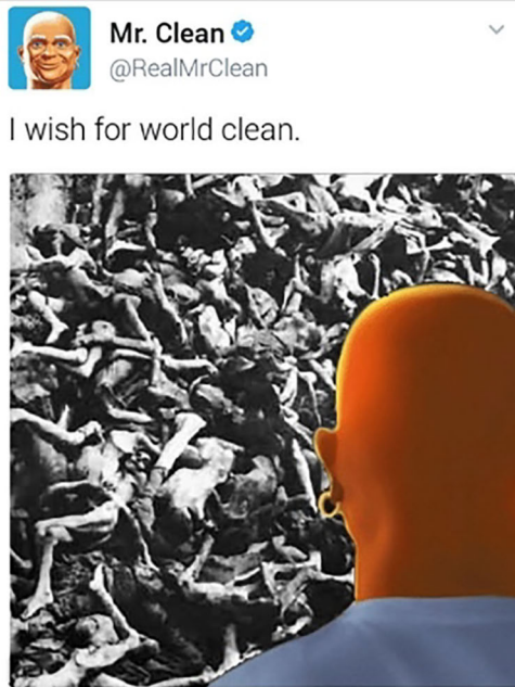
Abbildung 3: Holocaustverherrlichender Medientransfer in ›Mr Clean‹-Meme I