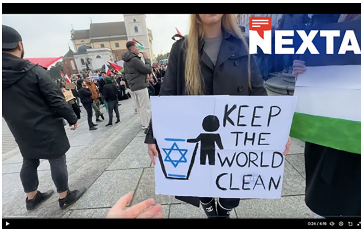
Abbildung 5: Kontinuität des antisemitischen Motivs ›ethnic cleansing‹ in israel-bezogenem Antisemitismus

Diese geschichtliche Überhöhung führte dazu, dass die nationalsozialistische Ideologie den Schein einer Verpflichtung für zukünftige Generationen transportierte und damit eine höhere Akzeptanz ungewöhnlicher Mittel für die Erreichung des Ziels einsetzt.