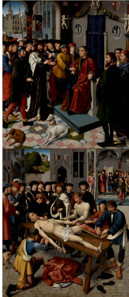
Abb. 1: Gerard David, Das Urteil des Kambyses und die Schindung des Sisamnes , 1498, Öl auf Holz, je 182,3 x 159,2cm, Groeningemuseum, Brügge

In der ersten Tafel verbildlichte Gerard David 2 die Festnahme des korrupten