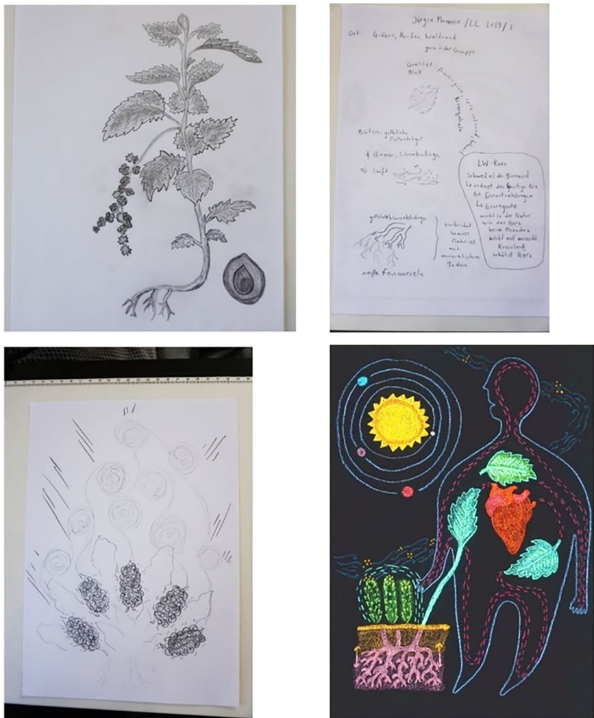
Abb. 1: Die Brennnessel im biodynamischen Kosmos.