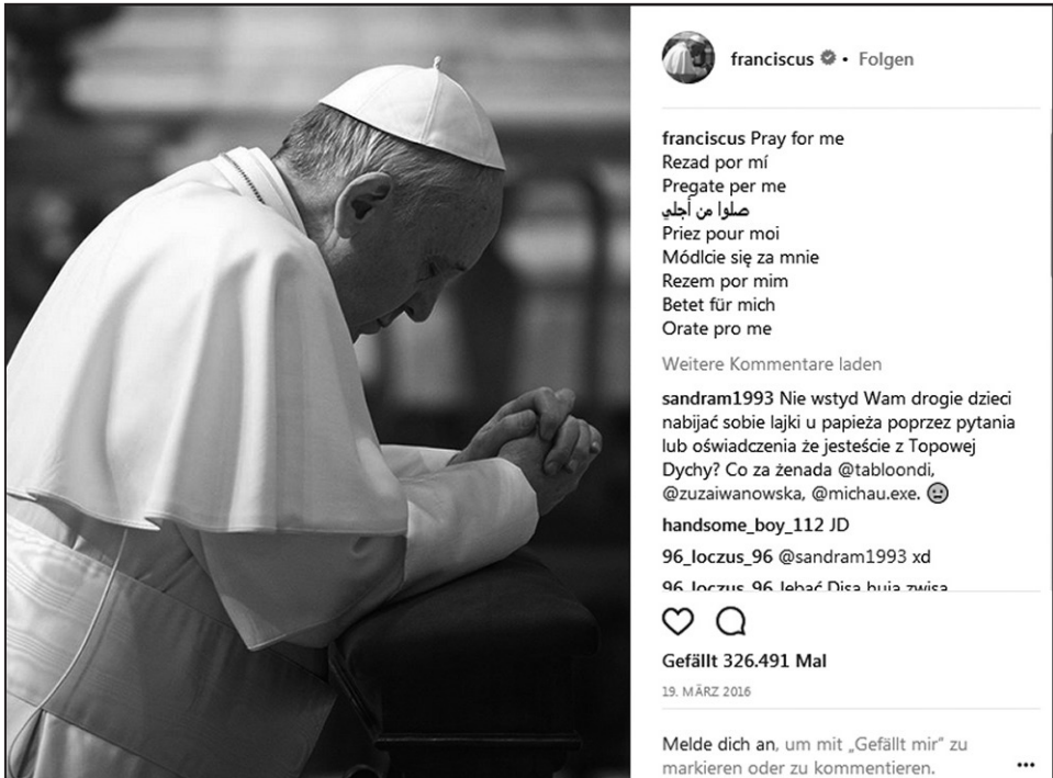
Abbildung 1: Screenshot, www.instagram.com/franciscus , 20.3.2018