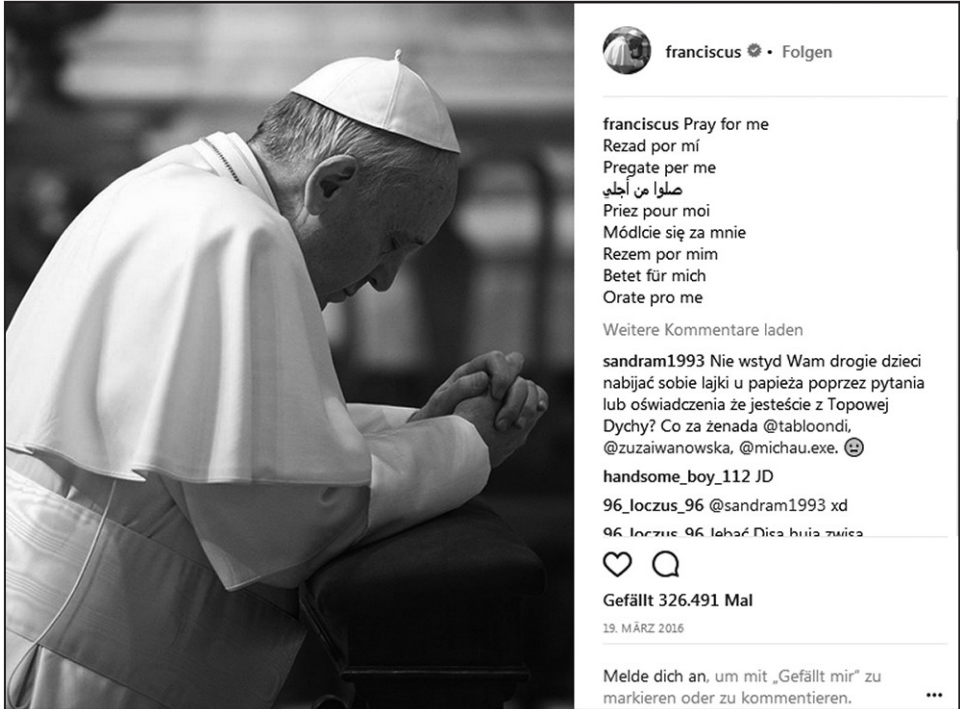
Abbildung 1: Screenshot, www.instagram.com/franciscus , 20.3.2018

wart des Instagram-Gründers @kevin, sein erstes Bild gepostet hat. Der geistvolle und geistreiche römisch-katholische Influencer kennt kein Limit, inzwischen folgen ihm 5,5 Millionen Menschen. 5