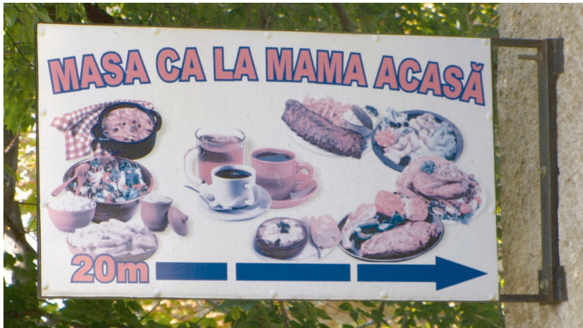
Werbung für ein Lokal in Chişinău (Rep. Moldau, 2018), zu Deutsch etwa: ‚Futtern wie bei Mutttern‘; Bild: Jana Stöxen

Dass kirchliche Feste nicht nur ob ihrer religiösen Basis, sondern auch durch die dabei stattfindende Vergemeinschaftung von den Führenden der Sowjetunion kritisch beäugt wurden, wundert daher kaum: Zusammenkünfte wie diese boten und bieten „eine hervorragende Möglichkeit, Netzwerke zu knüpfen, Allianzen zu bestärken und Informationen zu handeln – wesentliche Faktoren zur Bewältigung des sowjetischen Lebens.“ 64 Auch ihre Popularität heute überrascht wiederum wenig, sind doch diese Kompetenzen ebenso unter dem Eindruck postsowjetischer Transformationskrisen Leitlinien im Bestreiten des Alltags. Wo die KPdSU also ‚falsche Gesinnung‘, fußend auf traditionell familiären und auch nationalistischen Werten sah, 65 schafft commensality heute durch die Herkunftsbindung der Festlichkeit Resilienz und Stabilität im transnationalen Feld.