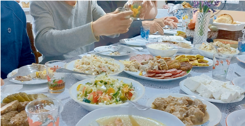
Gemeinsames Essen am orthodoxen Ostermontag (17.04.2023) im erweiterten Familienkreis

Das Panorama des Festtagstischs ist spiegelbildlich für die moldauische Migrationsgesellschaft, die vielfach im Modus des Pendelns lebt: Hier werden bekannte und vertraute Gerichte ebenso wie diverse Getränke aus eigener Herstellung stark betont. Das Primat des Heimatlichen schlägt sich in Brot und Sülze, Cognac und Compot 43 nieder. Die eigene Herstellung dieser als ‚moldauisch‘ gelabelten Produkte ist eine Quelle des Stolzes und wird durch die wiederholte Aufforderung, von allem zu kosten, noch verstärkt. Ebenso sind es die Eigenständigkeit des jeweiligen Haushalts und seine Möglichkeit zur (quasi-)autarken Lebensmittelproduktion, die hier als positiv bewertet werden. 44 Dass das oft bedeutet, neben weiteren Berufstätigkeiten bäuerliche Subsistenzwirtschaft auszuüben, ist dabei unausgesprochene Selbstverständlichkeit. Durch sie bleiben nicht nur bäuerliche Traditionen und Kompetenzen wach, auch trägt sie wortwörtlich zum notwendigen Zubrot bei – und erhält so als Strategie gegen Mangel und Inflation u.a. durch die Vorratshaltungen an eingemachtem Obst, Gemüse und Fleisch den als so charakteristisch empfundenen und betonten Geschmack des Vertrauten. 45