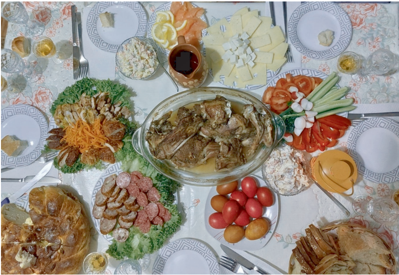
Reich gedeckter Tisch in der orthodoxen Osternacht 2023 im Haus von Radus Familie, Republik Moldau

An Feiertagen wird aufgetischt. Die Republik Moldau bildet dabei keine Ausnahme; sie ist vielmehr ein lebhaftes Beispiel für reich gedeckte Festtagstische. Gerade das Osterfest ist nicht nur religiös, sondern auch kulinarisch einer der Höhepunkte des Jahres. Diesem geht mit der Passionszeit eine intensive Fastenperiode voraus, in der nicht wenige orthodoxe Christ:innen – auch Radus Familie – de facto vegan ( de post ) essen.