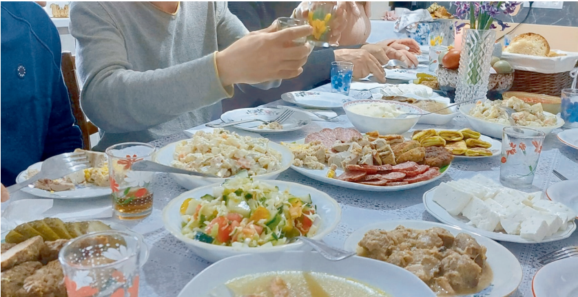
Gemeinsames Essen am orthodoxen Ostermontag (17.04.2023) im erweiterten Familienkreis

Das Panorama des Festtagstischs ist spiegelbildlich für die moldauische Migrationsgesellschaft, die vielfach im Modus des Pendelns lebt: Hier werden bekannte und vertraute Gerichte ebenso wie diverse Getränke aus eigener Herstellung stark betont. Das Primat des Heimatlichen schlägt sich in Brot und Sülze, Cognac und Compot 43 nieder. Die eigene Herstellung dieser als ‚moldauisch‘ gelabelten Produkte ist eine Quelle des Stolzes und wird durch die wiederholte Aufforderung, von allem zu kosten, noch verstärkt. Ebenso sind es die Eigenständigkeit des jeweiligen Haushalts und seine Möglichkeit zur (quasi-)autarken Lebensmittelproduktion, die hier als positiv bewertet werden. 44 Dass das oft bedeutet, neben weiteren Berufstätigkeiten bäuerliche Subsistenzwirtschaft auszuüben, ist dabei unausgesprochene Selbstverständlichkeit. Durch sie bleiben nicht nur bäuerliche Traditionen und Kompetenzen wach, auch trägt sie wortwörtlich zum notwendigen Zubrot bei – und erhält so als Strategie gegen Mangel und Inflation u.a. durch die Vorratshaltungen an eingemachtem Obst, Gemüse und Fleisch den als so charakteristisch empfundenen und betonten Geschmack des Vertrauten. 45