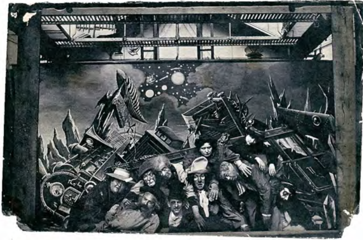
Abb. 10: Innenaufnahme aus dem Studio in Montreuil: Szenenbild aus LE VOYAGE À TRAVERS L'IMPOSSIBLE (1904). Oben ist die Struktur des Glasateliers zu erkennen, rechts unten im Bild Georges Méliès.

Mit und über Méliès hinaus lässt sich feststellen, dass das späte 19. und frühe 20. Jahrhundert in vielen Bereichen eine besondere Sensibilität für das Licht als Medium künstlerischen Ausdrucks entwickelte. Ein Beleg für diese These sind die Tanzdarbietungen von Loïe Fuller. Für ihre Auftritte entwickelte Fuller um die Jahrhundertwende eine technisch versierte Bühneneinrichtung, deren zentrales Element, ein Boden aus farbigen Glasplatten, von unten mit elektrischen Scheinwerfern beleuchtet wurde. Durch ein ununterbrochen die Farbe wechselndes Licht illuminiert, schienen die weißen Stoffe ihres schmetterlingsähnlichen Kleides in der intensiven Bewegung des Tanzes den Körper der Tänzerin gleichsam in eine schwebende, immaterielle Lichtgestalt zu verwandeln. 17