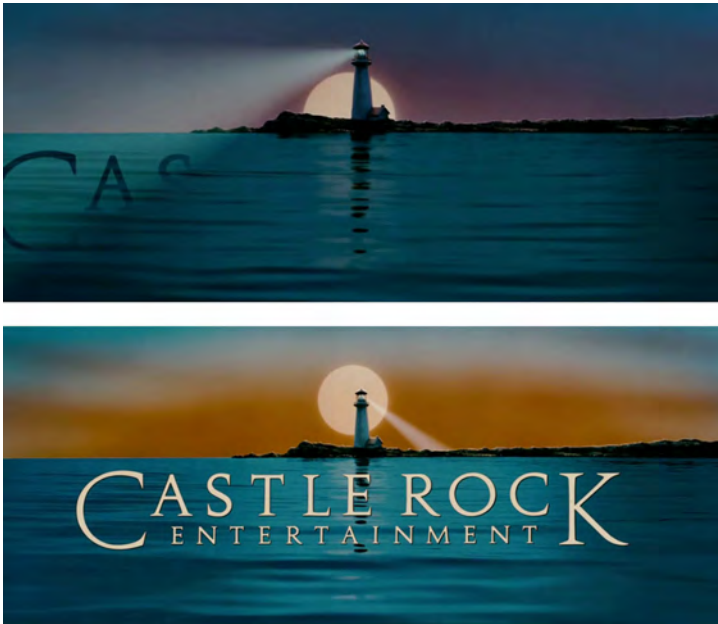
Abb. 12: Intro von »Castle Rock Entertainment«

des Lichts als weltliches und zugleich symbolisches Phänomen, vorrangig jedoch seine konstitutive Rolle als Medium, das die Existenz von Film und Kino in ihrer elementaren Beschaffenheit als Lichtbild und Lichtprojektion begründet. 32 Was sich im Produktionslogo als universale Bestimmung des Lichts ankündigt, konkretisiert sich im Film selbst durch den jeweils spezifischen Lichteinsatz, der ein nahezu unerschöpfliches Repertoire filmischer Ausdrucksformen eröffnet.