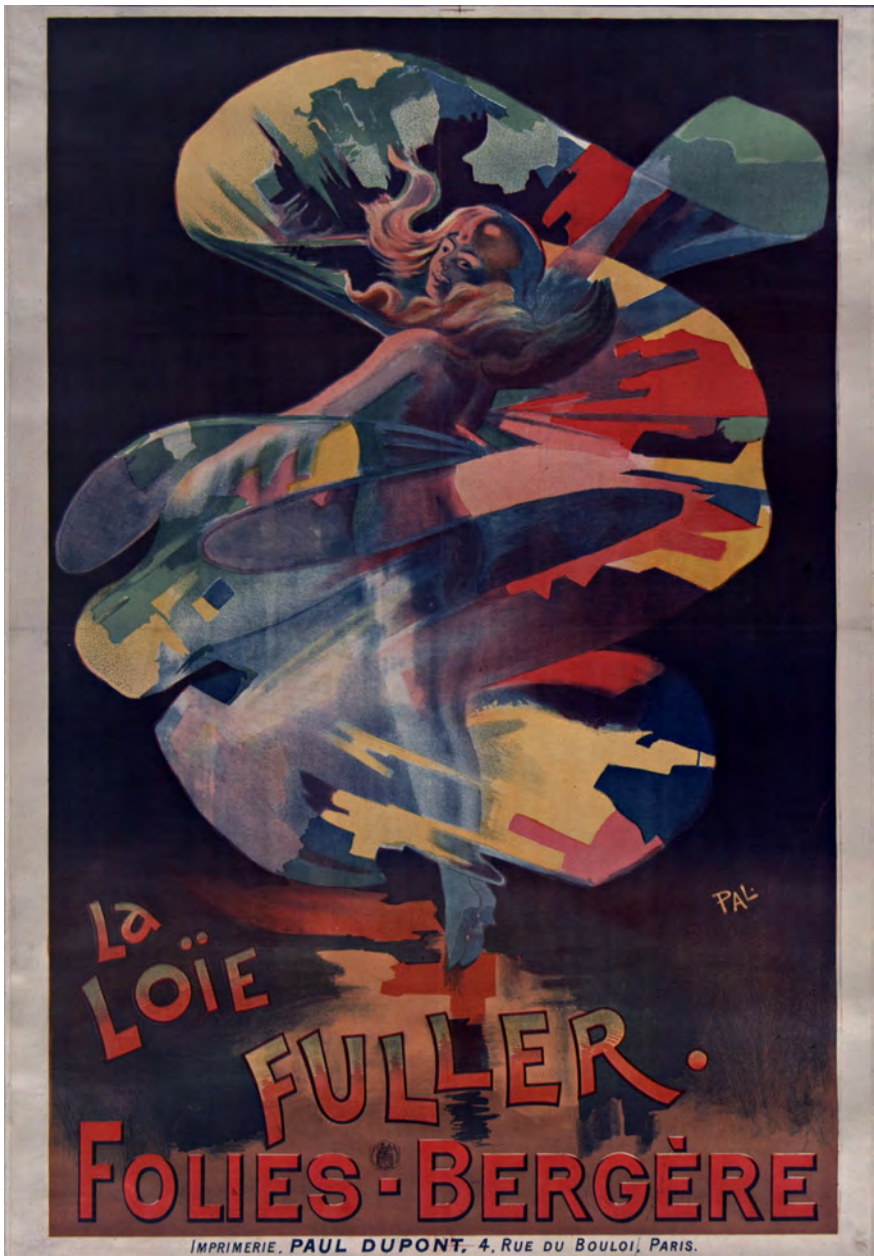
Abb. 11: Jean de Paléologue, La Loïe Fuller – Folies Bergère, Plakat, Frankreich 1897