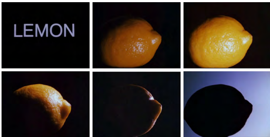
Abb. 13-18: LEMON (1969). Hollis Frampton

Tradition der Stillebenmalerei 47 plastisch vor Augen geführt. Bei statischer Kameraeinstellung ließ er eine künstliche Lichtquelle um das titelgebende, vor neutralem Hintergrund und nah an der Kamera platzierte Objekt bewegen (Abb. 13–18). Die Ergebnisse sind erstaunlich: Mal erscheint die Zitrone im Halbschatten, was Assoziationen an ein Kaminfeuer weckt; mal wird sie von einem hellen Vorderlicht erfasst, wodurch die Porenstruktur ihrer gelben »Haut« und das Reflexionsverhalten des Lichts stärker hervortreten und eine sensuell-haptische Filmwahrnehmung fördern. Ein anderes Mal erzeugt modellierendes Seitenlicht tiefe Schatten am Objekt, wodurch es plastischer und das Bild insgesamt dramatischer wirkt. Ein seitlich und von hinten einfallendes Licht zieht dann eine schimmernde Umrisslinie um Teile der Zitrone, die allmählich im Dunkel zu versinken scheint – bis sie schließlich, vor einem heller werdenden Hintergrund deutlich konturiert, nur noch als schwarze Silhouette aufleuchtet und das Motiv nun stärker der Realität entrückt erscheint. Der Lichtwechsel allein verschiebt hier die Identität des Dargestellten und veranschaulicht, geradezu lehrbuchartig, die interpretativ-stilisierende Wirkung gezielter Lichtregie, die das Bildmotiv sowohl in unterschiedliche Farben als auch in wechselnde Stimmungen kleidet.