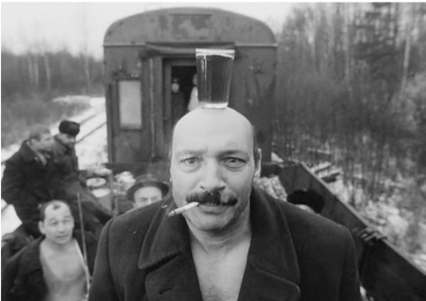
Abb. 249-253: CHRUSTALJOW, MASHINU! (1998). Alexej German, K: Vladimir Ilyin