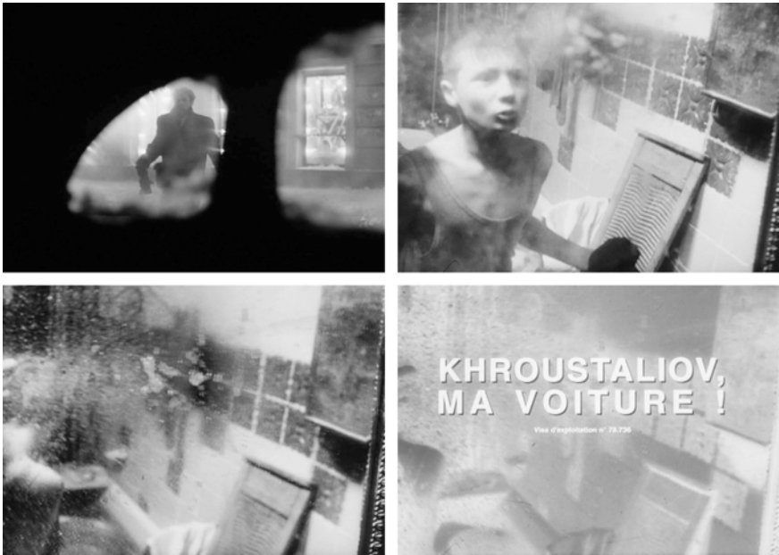
Abb. 215-218: CHRUSTALJOW, MASHINU! (1998). Alexej German, K: Vladimir Ilyin

Emblematisch für diesen Film, der hermeneutisch wie strukturell irritiert, flackert und blendet, spiegelt die Lichtwirkung des Titelbilds die Ästhetik der Überstrahlung auf prägnante Weise wider. Zudem wirken sowohl die Geste des Anspuckens als auch die visuelle Gestaltung wie eine direkte Ansprache des Regisseurs an sein Publikum 34 – weniger als bloße Provokation denn als eine Geste der Entbergung, als Ankündigung eines Films, der sein Publikum zwingt, sich den unbequemen Wahrheiten und rohen Emotionen zu stellen, indem er Verdrängtes aus dem Nebel der Vergangenheit ans Licht rückt.