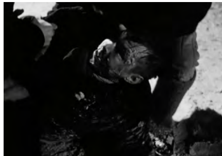
Abb. 211-212: CHRUSTALJOW, MASHINU! (1998). Alexej German, K: Vladimir Ilyin