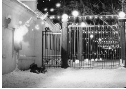
Abb. 209-210: CHRUSTALJOW, MASHINU! (1998). Alexej German, K: Vladimir Ilyin

Als wäre nichts geschehen, richtet sich Fedja auf und setzt seinen Weg fort. Er murmelt, pfeift und singt etwas vor sich hin, wirft seine Mütze hoch in die Luft. Die Kamera folgt ihm nach rechts, bis er vor einem am Straßenrand geparkten Opel stehen bleibt. Und wieder »brennen« ihm die Finger: Er schleicht sich an das Auto heran, ergreift mit beiden Händen die kleine Zeppelin-Figur auf dem Kühler und versucht, diese mit Gewalt abzureißen. Überraschend blitzen die Wagenscheinwerfer auf und gleich mehrere schwarzbemäntelte Gestalten stürmen aus dem Fahrzeug. Gemeinsam prügeln sie auf Fedja ein, schleppen ihn auf das Parkgelände und sperren ihn in einem Gartenhäuschen ein. Der plötzliche Gewaltausbruch wird auf visueller Ebene von harten Helldunkel-Kontrasten und hektischen Kamerabewegungen begleitet (Abb. 211–212). Endgültig begreift man, dass diese nächtliche, vom Licht verzauberte Welt alles andere als friedlich ist. Jederzeit kann die stalinistische Terrormaschine zuschlagen, wofür der aufragende Stalin-Turm als stummes Symbol der Überwachung und Strafe ein markantes Zeichen setzt. Dass die Gewalt ausgerechnet unter seiner Präsenz einsetzt, ist kein Zufall. Im Zwischenreich von Licht und Schatten, zwischen festlichem Glanz und grell ausgeleuchteter Brutalität, pendelt das Leben – stets bedroht, zermalmt zu werden. Niemand ist vor den Agenten der Diktatur sicher.