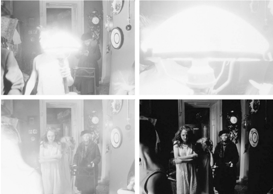
Abb. 245-248: CHRUSTALJOW, MASHINU! (1998). Alexej German, K: Vladimir Ilyin