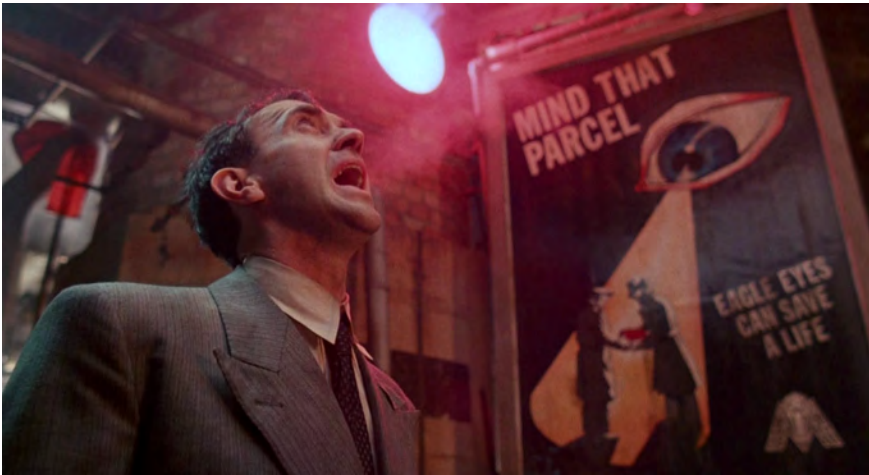
Abb. 238: BRAZIL (1985). Terry Gilliam, K: Roger Pratt