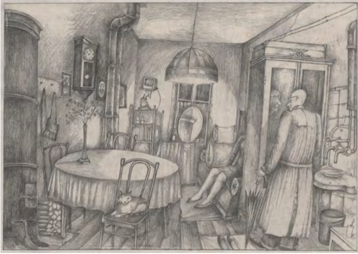
Abb. 255: Vladimir Svetozarov, Das Zimmer von Sonja Marmeladova , 1991. Bleistift auf Papier, 29,5 × 42 cm. ГЛМК – Staatliches Zentralfilmuseum Moskau