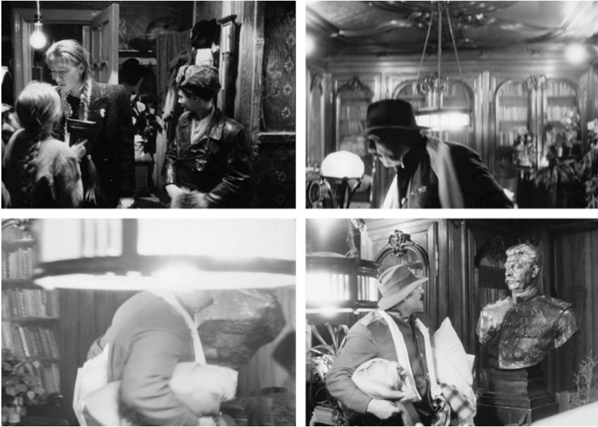
Abb. 234-237: CHRUSTALJOW, MASHINU! (1998). Alexej German, K: Vladimir Ilyin