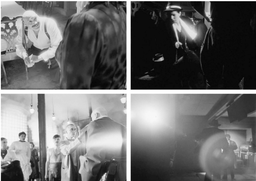
Abb. 226-229: CHRUSTALJOW, MASHINU! (1998). Alexej German, K: Vladimir Ilyin

Vom menschlichen Atem beschlagene oder mit einer Eisschicht überzogene Fensterscheiben erzeugen innerbildliche Zonen diffuser Helligkeit. Helle Objekte, etwa das weiße Hemd des Arztes oder seine charakteristische Glatze, irisieren im grellen Widerschein künstlicher Lichtquellen (Abb. 226). Gezielte Spotbeleuchtung lässt im Dunkel einzelne Dinge, wie einen weißen Schal, zu sekundären Lichtquellen werden (Abb. 227). Am Bildrand treten wiederholt markante Lichtschleier, sogenannte Flicker-Effekte, auf und breiten sich horizontal im Kader aus, sobald die Kamera eine Lichtquelle passiert und diese aus dem Bild gleiten lässt (Abb. 228, rechter Rand). Hier – wie im gesamten Film – avanciert das Licht sowohl als flüchtig-flimmernde Erscheinung als auch als taktile, scheinbar greifbare Substanz des Bildes zum optischen Kristallisationspunkt.