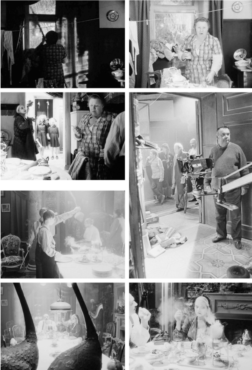
Abb. 219-221, 223-225: CHRUSTALJOW, MASHINU! (1998). Alexej German, K: Vladimir Ilyin Abb. 222: Produktionsaufnahme vom Set

Anschaulich zeigt dies die Szene am Frühstückstisch: Der Arzt Jurij Glinskij und seine Gattin erscheinen in einer Totalen, optisch gerahmt von zwei Statuetten exotischer Vögel. In dunkler Silhouette akzentuieren die Statuetten die vollständig überbelichtete