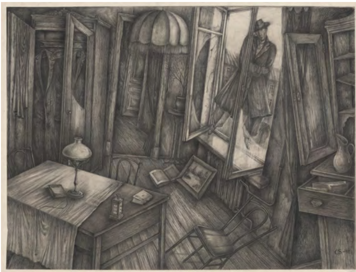
Abb. 254: Vladimir Svetozarov, Die Flucht des Generals , 1991. Bleistift auf Papier, 52 × 69 cm. ГИММК – Staatliches Zentralfilmmuseum Moskau

Markant ist die Inszenierung der Blickkonstellationen: der Blick aus dem Bild (Katze), der gespiegelte Blick (Lindberg) und der verborgene Blick (Sonja) verweisen auf zentrale Wahrnehmungsprozesse des Films – Sehen und Gesehenwerden, Zeigen und Verhüllen, Sichtbarkeit und Blendung. Auf diese Weise greift das Blatt jene visuelle Spannung und surreal-groteske Überzeichnung vor, die den späteren Film kennzeichnen, und verdeutlicht exemplarisch die zentrale Rolle der Lichtregie im Hinblick auf die präfilmische Gestaltung im zeichnerischen Entwurf.