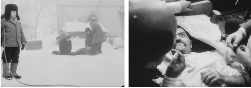
Abb. 213-214: CHRUSTALJOW, MASHINU! (1998). Alexej German, K: Vladimir Ilyin

sowjetischen Alltags ist im bachtinschen Sinne karnevalesk, bizarr und durchtränkt von abgründigem schwarzem Humor. Sie konstruiert eine Welt, in der Komik und Gewalt, Grausames und Banales in einem grotesken Reigen ineinander übergehen – vergleichbar mit der Bildwelt eines Hieronymus Bosch.