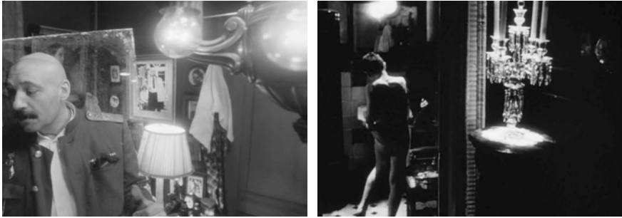
Abb. 232-233: CHRUSTALJOW, MASHINU! (1998). Alexej German, K: Vladimir Ilyin

Bereits an diesem Beispiel wird greifbar, dass die diegetischen Lichtquellen in CHRUSTALJOW, MASHINU! nicht nur zu den auffälligsten Elementen der Mise-en-Scène zählen, sondern das Bildgeschehen aktiv gestalten und kommentieren. Der Film präsentiert ein breites Spektrum an Spielarten einer solchen performativen Funktion künstlicher Lichtquellen. In einer Einstellung hängt eine Glühlampe dicht über den Köpfen der sprechenden Figuren und wird zu einem integralen Bestandteil ihrer Konstellation (Abb. 234). In der Sequenz mit Lindberg und Sonja Marmeladova in Sonjas Unterkunft hängt von der Decke eine Lampe herab und pendelt wie von Geisterhand bewegt an einer langen Schnur hin und her. Ihr unablässiges Schwingen bringt latente Unruhe in die Szene, die in der evozierten Anspannung und im inhaltlichen Zusammenhang sinnfällig aufgeht. Zum Schluss hocken beide Protagonisten auf dem Boden, in halbe Umarmung verfallen, und blicken direkt in die Kamera. Sonja flüstert: »Ich habe Angst.« Diese Worte muten zunächst paradox an, da Sonja als Agentin der Staatsicherheit die Fäden zieht und Lindbergs Schicksal in der Hand hat. Doch ihr Flüstern enthüllt eine tiefere Ebene: das Gefühl permanenter Bedrohung, das jede vermeintliche Kontrolle untergräbt. Die Szene verweist auf das Schicksal aller Untertanen: Gerade am Beispiel von Stalins Diktatur lehrt die Geschichte, dass selbst die treuesten Diener »Leviathans« jederzeit der blinden Willkür des Regimes zum Opfer fallen können.