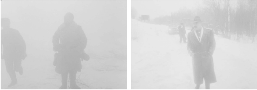
Abb. 230-231: CHRUSTALJOW, MASHINU! (1998). Alexej German, K: Vladimir Ilyin