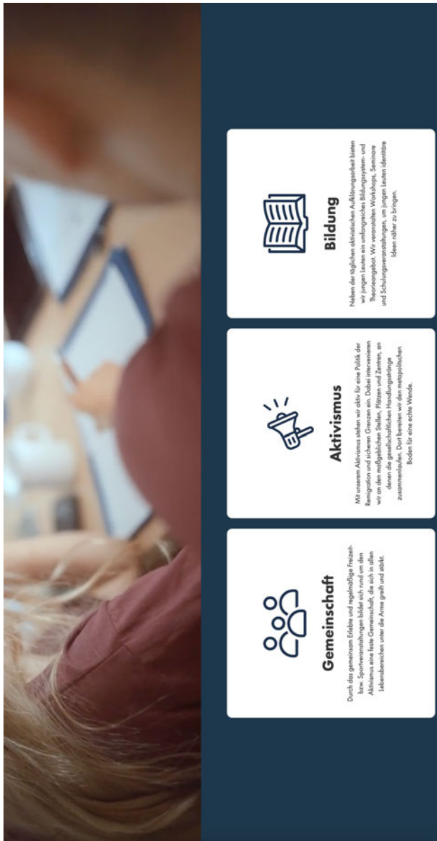
Abbildung 6: Reconquista 21