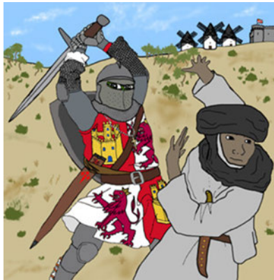
Abbildung 1: Pepe der Frosch