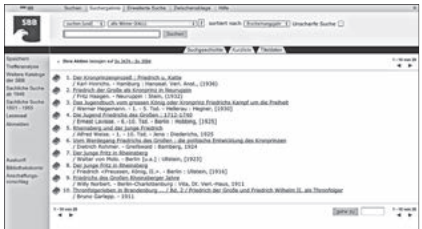
Beispiel für die Anzeige von zwölf Hierarchieebenen (oben) und zur Anzeige im OPAC der SBB

zu Friedrich II. über 4.000 Titel recherchierbar