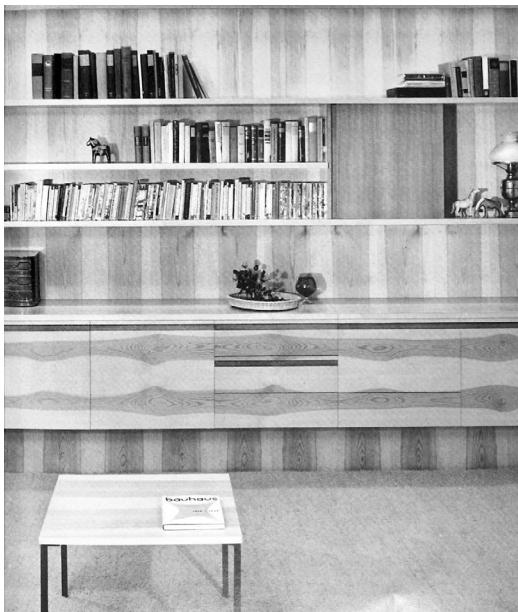
Abb. 1 Schrankmöbel im Stil des «Gelsenkirchener Barock» (1954)