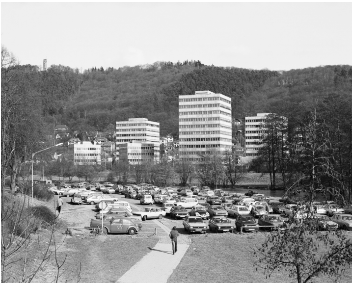
Bildarchiv Foto Marburg, B 3.438/12