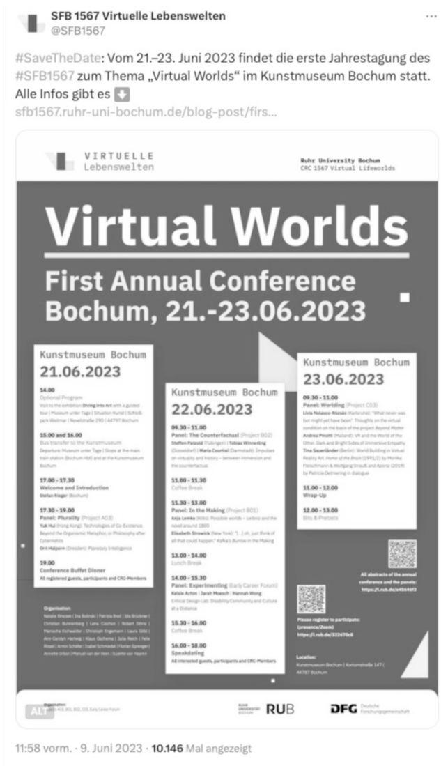
Abb. 1: @SFB1567 (9. Juni 2023, 11:58)

Es folgt ein Diskurs öffnender Tweet, der in einem Bereich des Dazwischen zu situieren ist: Einerseits kündigt er in Echtzeit-Kommunikation den Beginn der Veranstaltung an und erfüllt daher eine organisatorische Funktion, andererseits markiert er den Startpunkt der inhaltlichen Begleitung, die sich im anknapfenden Thread manifestiert: