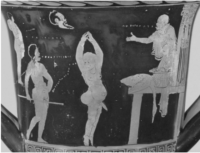
Abb. 1: Anklage eines Diebes. Die alte Frau auf dem ›Goose-Play‹-Krater in New York

Maskendarstellungen auf Phlyakenvasen weisen fast allesamt Falten auf; so auch Figuren mit bartlosen männlichen Masken, die als ›jung‹ zu verstehen sind. 19 Dies zeigt: Die Gesichtsfalten dienen nicht nur als Alterszeichen, sondern auch als Merkmal von Hässlichkeit, als Inversion des griechischen – und unteritalischen – Schönheitsideals, das sich auf die gesamte Figur erstreckt. 20 Wir konzentrieren uns daher nur auf solche alten Frauenfiguren, die durch ihre weiße Haarfarbe eindeutig als ›alt‹ charakterisiert werden. Diese treten auf sechs Vasenbildern in Erscheinung, die im Folgenden näher betrachtet werden. 21