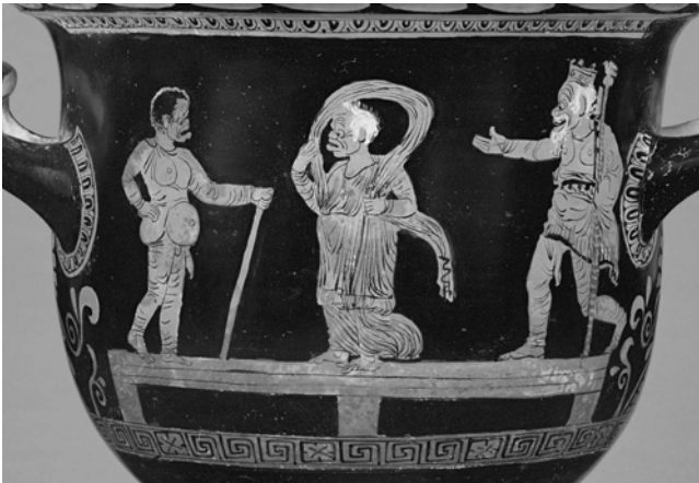
Abb. 3: Liebe kennt kein Alter? Glockenkrater in Malibu