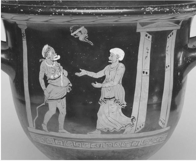
Abb. 2: Alte Frau begrüßt Heimkehrer (?) mit Leckereien im Gewand. Kelchkrater im Harvard Art Museum