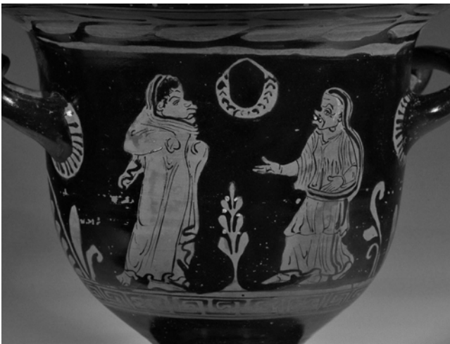
Abb. 4: Alt trifft Jung. Glockenkrater in Heidelberg

Den Gegensatz von Alt und Jung, von Hässlich und Schön thematisiert auch ein Glockenkrater in Heidelberg (Abb. 4). 35 Die auf diesem Stück dargestellte alte Frau entspricht nach Trendall dem Maskentyp ›U‹, 36 doch weicht sie gleichzeitig von diesem ab: Sie hat lange weiße Haare und eine Stupsnase, außerdem sind zwei Zähne im offenen Mund sichtbar. Durch die Gestaltung dieser Maske sollen ihre Altersmerkmale, im Gegensatz zu der ihr kontrastierend gegenübergestellten jüngeren Frau links, betont werden. Die wie eine Braut verhüllte junge Frau soll nach Trendall Typ ›RR‹, also der wolfsartigen Frau, entsprechen, obwohl sie vollkommen anders aussieht als die alte Frau auf dem Krater in Harvard. Bis auf ein längliches Gesicht mit schnauzenartig