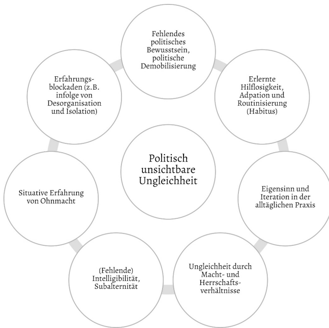
Grafik 14: Mechanismen, die Ungleichheit politisch unsichtbar machen