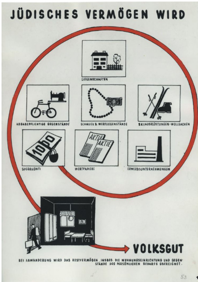
Abb. 1: Schaubild in einem Bericht der Treuhandstelle bei der Jüdischen Kultusgemeinde Prag an das Zentralamt für die Regelung der Judenfrage in Böhmen und Mähren der SS, 1943. 8

der von der nationalsozialistischen Reichsleitung gewünschten »Verwertung« – eigentlich: Beraubung – von jüdischem Eigentum durch Bremer Behörden vollzogen worden: Der Übergang von jüdischem in »arischen« Besitz – der Wechsel vom Objekt in Reichsmark. Verfolgt man die sehr bürokratisch dokumentierten »Verwertungsketten«, dann wird offenbar, wie wichtig der Aspekt der Beraubung bei der Verfolgung der jüdischen Bevölkerung gewesen ist. Die folgende Grafik aus dem Jahr 1943 bringt das deutlich zur Anschauung: