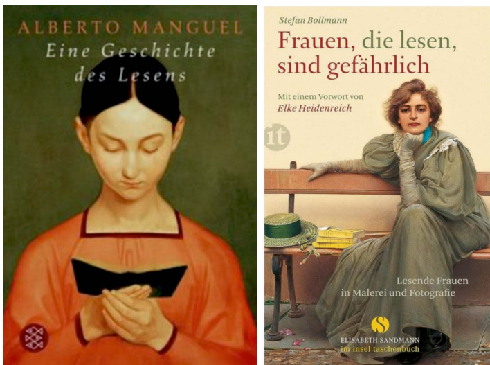
Abb. 6: Cover Frauen, die Lesen, sind gefährlich.