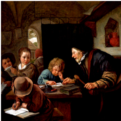
Abbildung 8: Jan Steen: Der Schullehrer (um 1668) (Trigg 2018: 135)

im konkreten Leseprozess, sondern zugleich um die Dimension des lesenden Subjekts, dessen Wissen, Motivationen usw., sowie um die Dimension der sozialen Ebene. Diese richtet sich darauf, Schüler*innen zu kompetenter Anschlusskommunikation zu befähigen, welche das Verstehen vertieft und einen erheblichen Leseanreiz darstellt. Zugleich handelt es sich bei dieser Ebene um alle interaktiven Situationen, die »das Lesen jeweils ermöglichen, erfordern, nahelegen, steuern, inhaltlich ausrichten, modal bestimmen usw.« (ebd.: 25). Sie verorten sich je nach Lebensphase in der Familie, der Schule, unter Peers oder in der Teilhabe am kulturellen Leben. Der Leseforscher Graf spricht vom Lesemodus der Partizipation, den Jugendliche mit zunehmendem Alter in drei Ausführungen praktizieren: als Teilnahme an privater und öffentlicher Kommunikation, als Transfer des Gelesenen in die soziale Wirklichkeit und als literarische oder Allgemeinbildung (vgl. Graf 2007: 133).