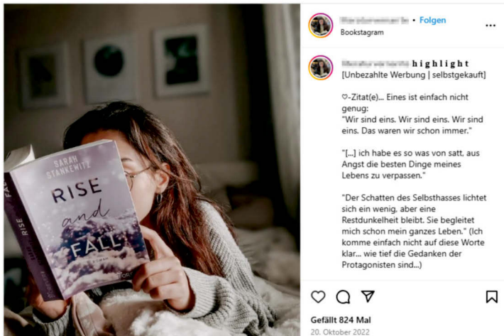
Abb. 9: Lesen im Bett 8

Ziel der weitgehend stereotypen Ästhetik der bildvermittelten Online-Kommunikationen ist es, einen angesagten zeitgemäßen Lebensstil und Geschmack auszuweisen sowie die eigene soziale Positionierung zu affirmieren (vgl. Schneider 2018: 117ff.). Für jugendliche Leser*innen