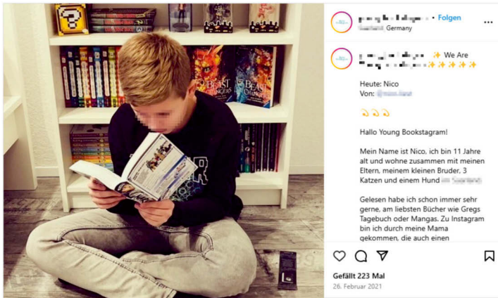
Abb. 11: Lesen vor dem Buchregal 10