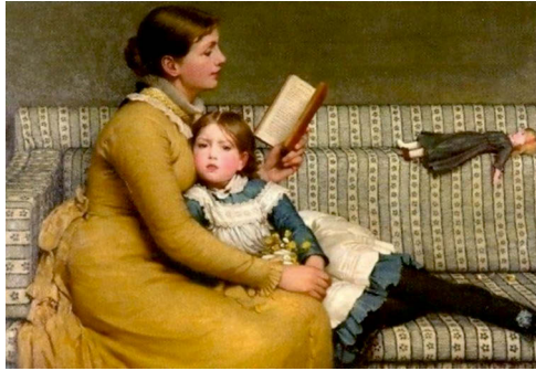
Abbildung 7: George Dunlop Leslie: Alice im Wunderland (um 1879) (Trigg 2018: 155).

Neben der Familie als informeller Lesesozialisationsinstanz kommt im späteren Kindes- und Jugendalter die Schule als formale Instanz für das Lesenlehren und -lernen hinzu (Abb. 8). 4 Wenngleich schulisch vermittelte Lesekompetenz von jeder/m einzelnen Schüler*in erworben und als messbare Leseverstehensleistung in allen Leseleistungsstudien wie PISA, IGLU u.a. individuell erhoben wird (in kritischer Perspektive dazu vgl. Abraham 2015), spannt die Lesedidaktik den Rahmen weiter auf. Dies zeigt sich im Mehrebenenmodell des Lesens (vgl. Rosebrock/Nix 2015: 15): Mit dem Ziel einer systematischen schulischen Leseförderung geht es hierbei nicht nur um die kognitiven Anforderungen