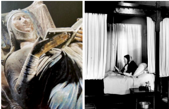
Abbildung 2: Kertész: Hospice de Beaune (Bollmann 2005: 34).

Abbildung 1: Grabmal der Eleonore von Aquitanien (Bollmann 2005: 26).