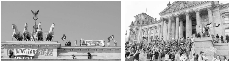
Abb. 43 (links): Aktivist*innen der Identitären Bewegung auf dem Brandenburger Tor (2016); Abb. 44 (rechts): Bild vom ›Sturm auf den Reichstag‹ (2020) 178

(b) Anschlussfähige gegenwärtige Bildgenres (Hassbilder, Protestbilder): Zudem sind zwei anschlussfähige Bildgenres zu nennen. Bilder von Fake News sowie rechte Memes weisen, aus ästhetischer und funktioneller Sicht, insbesondere Überschneidungen zu ›Hassbildern‹ und ›Protestbildern‹ auf. Charakterisierungen dieser Bildgattungen sind nun jeweils zu skizzieren und daraufhin mit Bildern von Fake News zu verflechten.