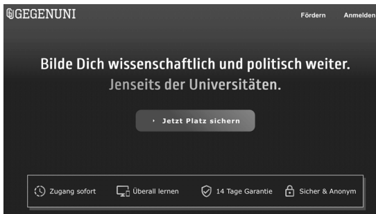
Abb. 33: Die Startseite der rechten ›GegenUni‹ 133

Zudem zeigt sich dies etwa in den minimalistischen und dadurch trendigen Gestaltungen vieler neurechter Logos. Etwa weisen die Signets der Identi-