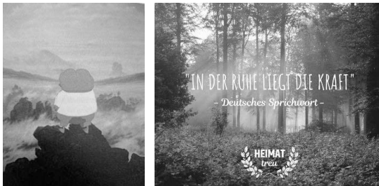
Abb. 28 (links): Darstellung mit Motivbezug zur Romantik; Abb. 29 (rechts): Darstellung eines rechten Instagram-Accounts mit Waldmotiv 101

Zum heterogenen Bildrepertoire gehört eine enorme Vielfalt an Gestaltungsweisen: Eine Sympathie mit Nationalismus oder Faschismus (u. a. durch Uniformen), klassische Malereien (insbesondere aus der Romantik (vgl. etwa Abb. 28), Motive von Friedrich dem Großen, Otto von Bismarck sowie Kriegen, Bezugnahmen auf das Mittelalter (durch Schwerter oder (Kreuz-)Ritter), ethnische und kulturelle Vorherrschaft, ›Identität‹, Cartoonfiguren (inklusive Anime und Manga), Schwarz-Weiß-Fotografien von Trümmerfrauen,