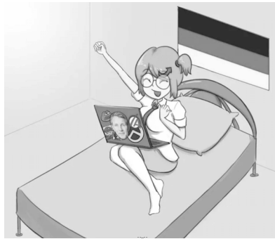
Abb. 39: Die rechte Mangafigur AfD-Chan 157

Abbildung 38 zeigt ein Motiv, das ebenso in diesem Feld zu verorten ist. Der sogenannte ›soyboy‹, ein »verweichlichte[r] und weibische[r] Soja-Junge« 156 steht einem maskulinen ›sane man‹ (Plural – ›men‹) gegenüber, der ›vernünftig‹ oder ›zurechnungsfähig‹ ist. Die Figuren der ›sane men‹ verkörpern auf rechten Memes die ›unbeirrbar‹en Männer, die sich keinem gesellschaftlichen Druck beugen. Sie stehen zu ihren Ansichten, in vorliegendem Fall etwa dazu, aufgrund ›wissenschaftlicher Fakten‹ junge Frauen attraktiv zu finden und alte oder übergewichtige Frauen abzuwerten. Hier kommt eine einfache digitale Zeichnung zum Einsatz: Insbesondere bei vorliegenden ›soyboy‹ sind die amateurhaften Merkmale der Internet Ugly -Ästhetik zu erkennen.