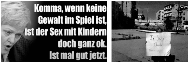
Abb. 45: (links): Ein ›Hassbild‹ mit Renate Künast (Ausschnitt); Abb. 46 (rechts): Ein ›Protestbild‹, das im Zuge von ›Je suis Charlie‹ verbreitet wurde 189

Als ›Protestbilder‹ sind sehr unterschiedliche visuelle Darstellungen zu bezeichnen. Primär zählen appellierende, emotionale Wirkungen entfaltende oder etwa Solidarität bekundende Selbstporträts dazu (in der Regel mit einem eigens geschriebenen Schild oder einem symbolträchtigen Objekt). Protestbilder sind überwiegend Standbilder aus Videos. Abbildung 46 zeigt ein Foto, das als Protestbild diskutiert wird. 190 Zudem sind amateurhafte Bildzeugnisse von Gewalttaten oder Straßenansammlungen mit dem Begriff zu bezeichnen. Protestbilder sind visuelle Gegenstimmen, die im Zuge von politischen Protesten in Umlauf geraten und ihre Wirkmächtigkeit durch ein gemeinsames und zeitnahes Auftreten entfalten. 191 Sie werden als »eine kollektive digitale Form des Demonstrierens« 192 verstanden, die eine Protestgemeinschaft zu konstituieren vermag. 193 Die visuellen Darstellungen beziehen sich aufeinander, sind Bestandteil eines Bildnetzwerks, weswegen ihnen eine ›memefication‹ attestiert werden kann. 194 Protestbilder dienen der Aufmerksamkeit für ein Thema. Sie können daher als »Strukturen, Prozesse und Strategien des Zu-sehen-Gebens auf dem Feld des Politischen« 195 verstanden werden. Produzent*innen und Verbreiter*innen dieses Bildgenres möchten politische Inhalte ins Bild setzen, die in ihren Augen verschwiegen