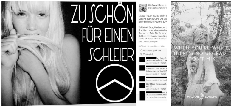
Abb. 30 (links): Professioneller Bildbeitrag der Identitären Bewegung; Abb. 31 (rechts): Professioneller Beitrag des Accounts »Madame Europa« auf Instagram 117

(c) Offenkundige Bezüge zu rechtsextremen Ideologien: In manchen Bildern sind offenkundige Bezüge zu rechten Ideologien zu finden. Als eine gewichtige Gestaltungsform in sozialen Netzwerken gilt etwa Fashwave (vgl. Abb. 32). 118 Kennzeichnend hierfür ist häufig die Adaption des in den 2010er-Jahren populär gewordenen Vaporwave -Stils. Charakteristisch sind eine Mischung greller Farben – insbesondere Lila und Türkis – vor dunklem Hintergrund sowie