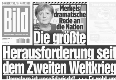
Abb. 47: Titelseite einer Bild-Zeitung 204

Ähnliche Motive wie auf den Titelseiten der Bild -Zeitung finden sich auf bild.de. Die Abbildungen 48 und 49 zeigen zwei Beispiele von bild.de. Hier sind etwa Merkel oder eine Gruppe Geflüchteter abgebildet. Das oben genannte Design der Bild -Zeitung ist auf bild.de lediglich zum Teil sichtbar: Die Schrift ist im Verhältnis zum Bild kleiner, zudem werden hier keine Begriffe unterstrichen. Alle drei Beispiele von Bild verwenden sehr professionelle Bilder.