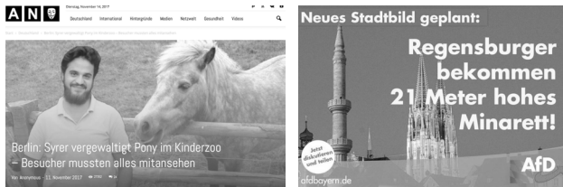
Abb. 52: (links): Eine Desinformation, bei der die Fotografie eines syrischen Geflüchteten auf eine andere Fotografie montiert wurde; Abb. 53 (rechts): Eine irreführende Bildmontage der AfD 218

Zudem wird bei Desinformationen eine »visuelle Leerstelle« diskutiert. Sie entsteht, wenn Fake News sich als schnelle Antwort auf ein tagespolitisches Geschehen verbreiten. Dieses »Visualisierungsvakuum« 219 charakterisiert der Medienwissenschaftler Bernhard Pörksen wie folgt: