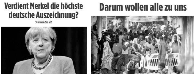
Abb. 48: (links): Fotografie von Angela Merkel in einem Beitrag auf bild.de; Abb. 49 (rechts): Fotografie von Geflüchteten in einem Beitrag auf bild.de 205

Ähnliche Motive wie auf den Titelseiten der Bild -Zeitung finden sich auf bild.de. Die Abbildungen 48 und 49 zeigen zwei Beispiele von bild.de. Hier sind etwa Merkel oder eine Gruppe Geflüchteter abgebildet. Das oben genannte Design der Bild -Zeitung ist auf bild.de lediglich zum Teil sichtbar: Die Schrift ist im Verhältnis zum Bild kleiner, zudem werden hier keine Begriffe unterstrichen. Alle drei Beispiele von Bild verwenden sehr professionelle Bilder.