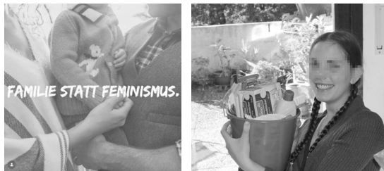
Abb. 40 (links): Rechtsalternative Bild-Text-Kombination, die Familienwerte hervorhebt; Abb. 41: Instagram-Beitrag einer Aktivist*in, die ›weiblich‹ gelesene Aufgaben kultiviert 170

gangene Zeiten sowohl inhaltlich als auch ästhetisch. 166 Dies drückt sich etwa in Neuinszenierung von zu Beginn des 20. Jahrhunderts modisch gewesenen Frisuren oder Kleidungsstilen aus. Mädchen und Frauen tragen geflochtene, lange Haare oder knöchellange Kleider und Röcke (s. auch Abb. 31). Weibliche Rechtsaußen-Akteur*innen präsentieren sich ebenso als traditionelle Frauen, die sich leidenschaftlich bei ursprünglich ›weiblich‹ gelesenen Aufgaben wie Putzen, Backen oder Stricken zeigen. 167 Abbildung 41 zeigt etwa eine Protagonistin der Identitären Bewegung, die freudestrahlend einen Putzeimer präsentiert. Diese ›Tradwife‹-Narrative sind ein integraler Bestandteil antifeministische Online-Subkulturen. 168 In Selbstdarstellungen ist zudem die Instrumentalisierung weiblicher Protagonist*innen zu beobachten: Eine Wertschätzung von Mädchen und Frauen erfolgt von rechten Akteur*innen weniger für ihre berufliche Arbeit, vielmehr werden sie oftmals als »Sinnbild für Schönheit und Jugend« 169 präsentiert (s. auch Abb. 30).