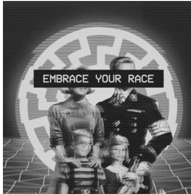
Abb. 32: Bild-Text-Kombination mit einer Fashwave -Ästhetik 127

Neben Fashwave ist zudem die Verwendung von Cathwave , Terrorwave oder Trumpwave zu beobachten. 128 Die Gestaltungsformen adaptieren mitunter nach einer ähnlichen Logik eine Retro-Optik, glorifizieren hingegen primär jeweils katholische Kreuzritter, rechtsradikale Terrorist*innen oder Donald Trump. Oftmals werden diese Verherrlichungen auch ohne eine an Vaporwave angelehnte Gestaltung umgesetzt. Abbildungen in Terrorwave -Optik zirkulieren vermehrt nach rechtsradikalen Anschlägen im Netz. Die Ästhetik kann wie folgt charakterisiert werden: