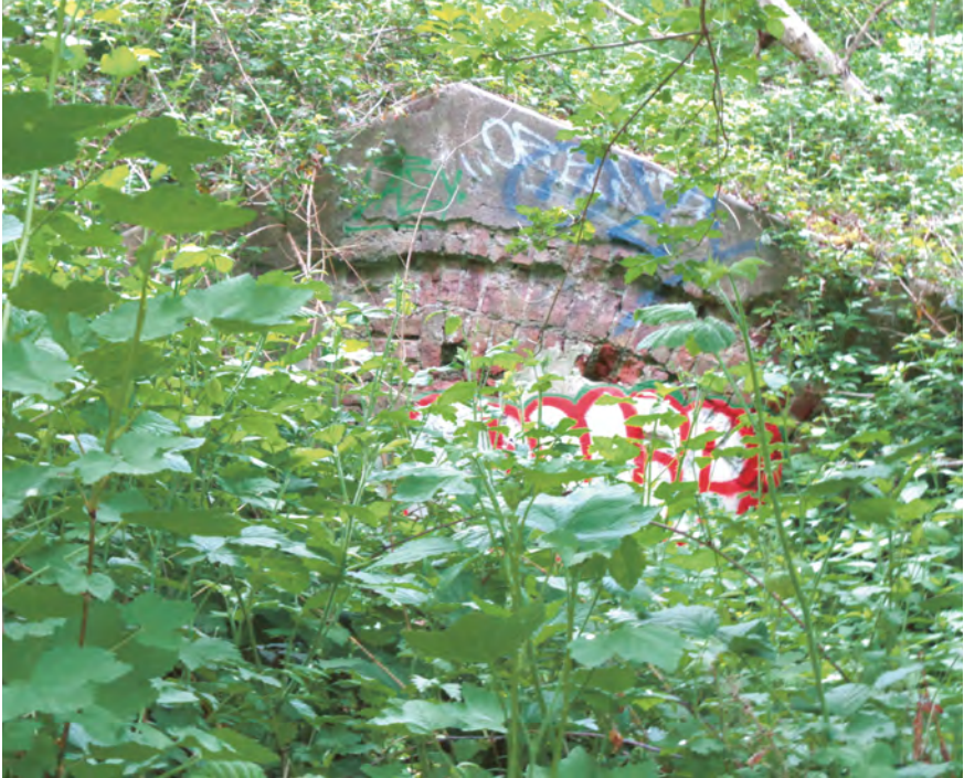
Abb. 3: Zwischenwerk im Waldgebiet, Köln-Vingst, Foto 2022.

Konkrete Nutzungen von Festungsbauten und Bunkern im und nach dem Zweiten Weltkrieg für Militär, als Lager oder Gefängnis sind offiziell noch darzustellen. Dieses Defizit begründen Behörden mit der Vernichtung von Quellen am Kriegsende und mit dem Einsturz des Kölner Stadtarchivs 2009. 44