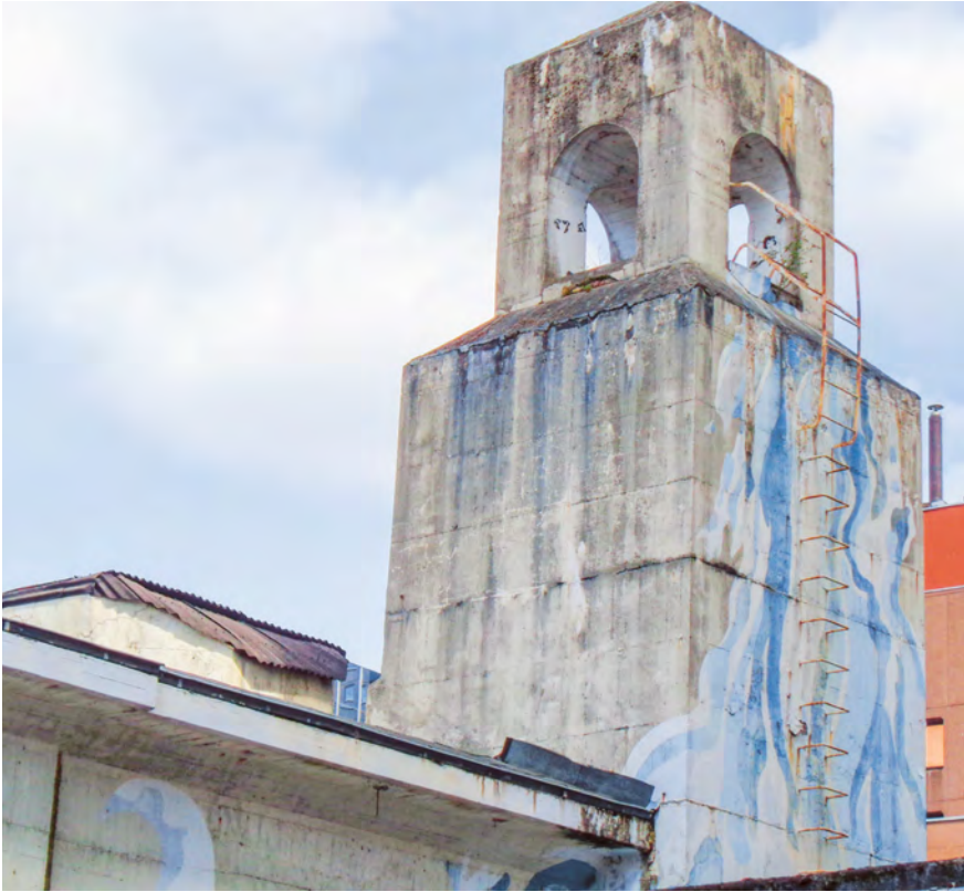
Abb. 1: Hochbunker Marktstraße mit angedeutetem Glockenturm, Köln-Raderberg, Foto 2022.

Leitung städtischer Architekten umgesetzt wurden. 22 Die Bauten sollten wehrhaft, zugleich aber getarnt, also ihrer Umgebung optisch angepasst gestaltet sein (z. B. mit regionalen Stilelementen oder ähnlich einem Kirchenbau – Abb. 1). Aufgrund der sich verschärfenden Notlage sowie des Mangels an Baustoffen und Bauarbeiter*innen wurde die Ausführung oft vereinfacht: Möglichst schnell erfolgten Aushub, Holzverschalungen und Betonguss inklusive Luftfilter und sanitärer Einrichtungen. Zu den Zwangsarbeiter*innen in Köln zählten Kriegsgefangene und KZ-Häftlinge: Aus ihnen bestand die Baubrigade der SS, die in der Kölner Messehalle als Außenstelle des Konzentrationslagers Buchenwald untergebracht war. 23