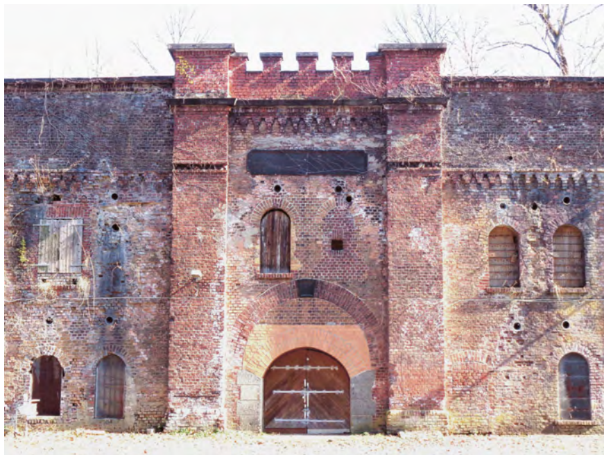
Abb. 2: Fort im äußeren Festungsring bei Köln-Mülheim, Foto 2022.

blieben sie ähnlich den teils unterirdischen Anlagen in den Waldzonen versteckt oder unentdeckt, verschlossen oder heimlich genutzt und schließlich vergessen. 35 Bis in die 1970er Jahre wurden Bunker- und Festungsbauten, nachdem sie von illegalen Nutzer*innen geräumt waren, übererdet. Von den 15 erhaltenen Werken des äußeren Festungsringes stehen noch heute einige leer (Abb. 2). 36 Generell zeigt sich die Tendenz, Gebäude im Inneren der Stadt – zumeist zivile Luftschutzbunker – zu nutzen, dagegen militärische Bauten außerhalb von Wohngebieten ähnlich den unterirdischen zu ignorieren. Über zahlreiche Tiefbunker an den Gleisanlagen gibt es bis heute kaum Informationen. Hier wäre mehr Transparenz oder sogar eine Öffnung für die Kultur und die Bürgerschaft konstruktiv und wünschenswert.