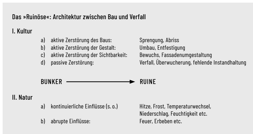
Abb. 4: Systematik der Zerstörungen von Architektur, Grafik 2022.

Architektur ist aufgrund ihrer Immobilität zwingend mit ihrem Ort und seiner Geschichte verknüpft, welche neben intendierten Baufunktionen und -nutzungen ihre Bedeutung bestimmen. Daraus ergibt sich ein kontinuierlicher Wandel zwischen Konstruktion und Destruktion auf beiden Zeichenebenen: auf der materiellen Seite im Zeitraum von der Entstehung bis zur Auflösung und auf der immateriellen Seite im Fall kultureller Überlieferungen auch über diese hinaus. Weitaus stärker als in geschützten Räumen präsentierte oder gelagerte Kunstwerke erfordert Architektur Instandhaltungen, denn sie ist vielerlei ruinösen Einflüssen ausgesetzt: kontinuierlichen und abrupten, natürlichen oder menschlich bedingten Prozessen (Abb. 4). Zerstörte und vernachlässigte Kriegsarchitektur weist eine destruktivistische Ästhetik »zwischen Tarnung und Warnung« 46 auf.