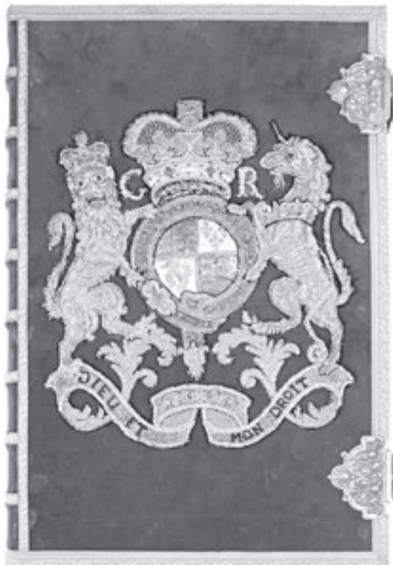
Abb. 4: Englische Prachtbibel von Georg I., 1717

1976 zog die Bibliothek an ihren jetzigen Standort in der Waterloostraße. Das Gebäude befindet sich in Zentrumsnähe in verkehrsgünstiger und meist ruhiger Lage – wenn kein Schützenfest oder ein Bundesligaspiel stattfindet. Der Ausbau der Technischen Hochschule Hannover zur Volluniversität wirkte sich auf die NLB dergestalt aus, dass ihr ab 1969 die geistes- und