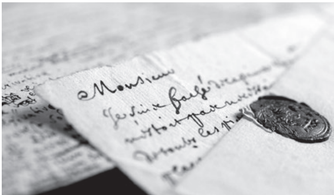
Abb. 5: Leibniz-Brief, Detail

besondere inhaltliche Schwerpunkte seit 2002