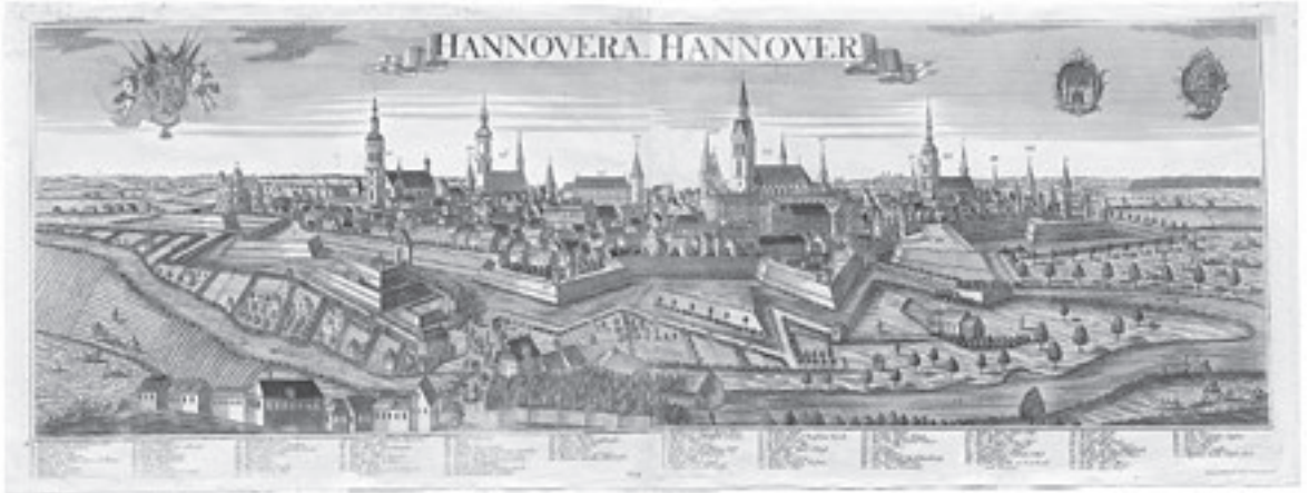
Abb. 2: Ansicht der Stadt Hannover, um 1760

binären Codes – die Grundlage der Computertechnik. Ebenso beschäftigte er sich mit philologischen und astronomischen Fragen. Er betätigte sich als Architekt und Ingenieur und war Erfinder von technischen Apparaten, unter anderem von Rechenmaschinen.