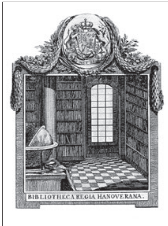
Abb. 1: Exlibris der Königlichen Bibliothek, 1776