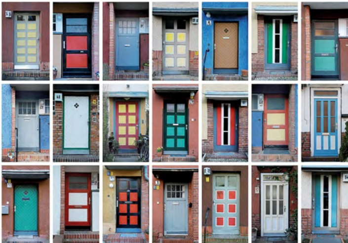
Abb. 3: Eingangstüren, Hufeisensiedlung Berlin von Bruno Taut

Ein Beispiel für ein anderes Verständnis des Verhältnisses von Gleichheit und Gerechtigkeit in der Architektur ist Bruno Tauts ab 1925 gebaute Hufeisensiedlung in Berlin. Diese ist mit circa 2000 Wohnungen wesentlich größer, steht aber ebenfalls unter wirtschaftlichem Druck. Trotzdem fördert Taut mit einfachen Mitteln bewusst eine Individualisierung. So baut er zum einen sehr unterschiedliche Haustypen, schafft in der städtebaulichen und straßenräumlichen Konfiguration vielfältige Lösungen und erreicht selbst bei gleichen Haustypen eine Individualisierung, zum Beispiel, indem er Türen, Fenster und auch den Putz farbig unterschiedlich fasst. Individualität äußert sich zwar zum Teil nur in der Farbe, aber die grundlegende Idee wird dennoch deutlich: Nicht Gleichheit als Ideal und als Synonym für Gerechtigkeit, sondern so viel Individualität, wie die Rahmenbedingungen es erlauben. Jedem mit seinen Bedürfnissen gerecht zu werden, ist das Ideal der Gerechtigkeit bei Taut; sein Ziel, die Verwirklichung der individuellen Persönlichkeit zu ermöglichen. Gemeinschaft denkt er von den Individuen her. Absolute Gleichheit würde für ihn bedeuten, dem Einzelnen gerade nicht gerecht zu werden, weil seine Individualität unbeachtet bliebe. 15