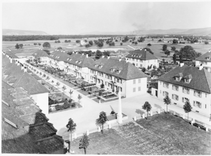
Abb. 2: Siedlung Freidorf. Fotograf: Theodor Hoffmann, Basel (1860–1925), 1. Januar 1924

Im Äußeren ist die Gestaltung zurückhaltend modern und erinnert an den Heimatschutzstil von Tessenow oder Schmitthenner. Die Konstruktion der Gebäude erfolgt ebenfalls auf Basis normierter, modularisierter und gleicher Einheiten, was Meyer besonders hervorhebt: »Ein Zellenbau. Typisiert, normalisiert, standardisiert, elektrifiziert. Mit viererlei Fenstern und viererlei Türen. Mit einziger Scheibennorm aller 1742 Fenster und mit einziger Füllungsnorm aller 1350 Zimmertüren. Mit Normaltyp der 150 Badewannen, 150 Zentralöfen, 150 Elektroherde, 150 Waschherde, 150 Elektroboiler. Mit Normalzimmerlänge, Normalzimmerhöhe, Normaltreppentritt, Normalglaslaube und Normalgartenhaus. Mit genormter Dachneigung, genormtem Dachgesims, genormtem Abfallrohr, genormter Abortgrube. Mit der Norm von Glockentaster, Ladenbeschlag, Haustürschloss, Fensterolive . . . und wo des Siedlers Sonderwunsch genormte Ausführung durchbrach, ging von ihm bezahltes Ding unentschädigt ins Eigentum Aller; Vergesellschaftung des Luxus!« 12