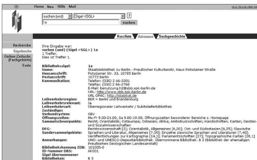
Abbildung 5: Adressenvollanzeige im Sigelverzeichnis online