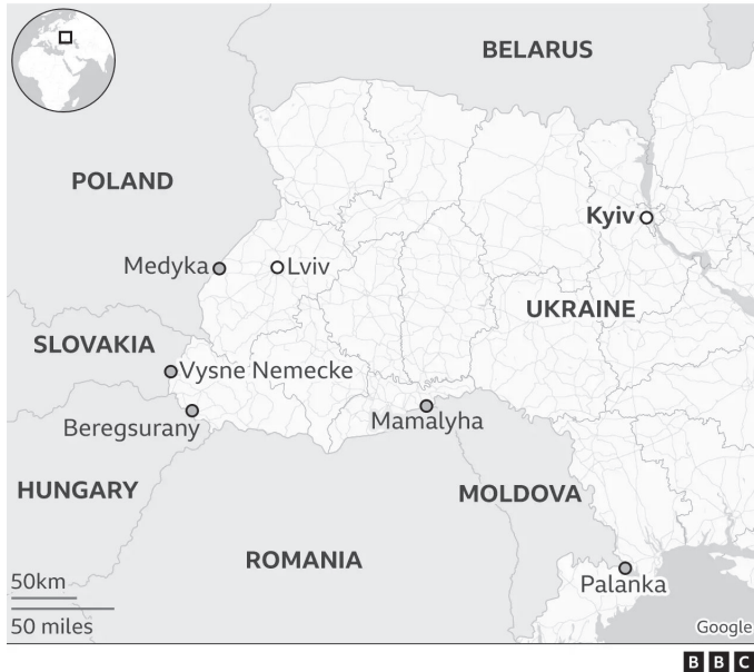
Abbildung 2: Einrichtungen an der ungarisch-ukrainischen Grenze. 10