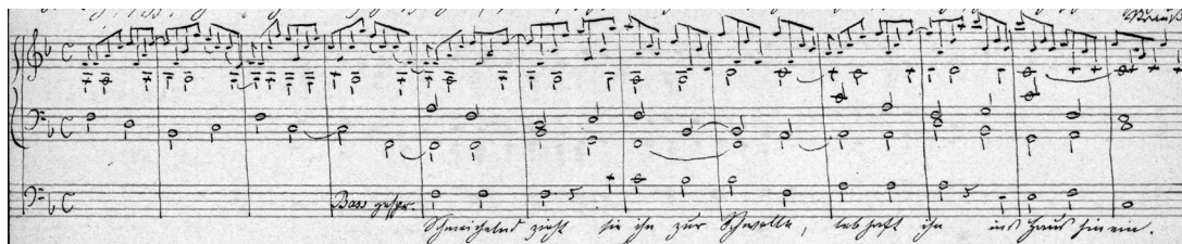
Abb. 3 Ein Terzkanon durchwindet unauffällig den Klaviersatz (Raff 1864, S. 72).

zunehmend komplexer werden. 20 Vom einfachen Synkopensatz wird die Entwicklung hin zu komplexer rhythmischer Gestaltung systematisch behandelt. Der Kurs umfasst Übungen zur Kanonkomposition sowie zum Einsatz von Augmentationen, Diminutionen, Engführungen und Krebsbildungen. Der Kanon wird in verschiedensten Intervallabständen, etwa als Sekund-, Terz- oder Quintkanon, gelehrt. Einen Schwerpunkt erfährt der doppelte Kontrapunkt, der für sämtliche Intervallabstände ober- und unterhalb des Cantus Firmus konzipiert wird. So finden sich auch Übungskompositionen zum doppelten Kontrapunkt im Intervallabstand der Tredezime in den Mitschriften. Immer wieder wird das Gelernte in Kompositionen umgesetzt, die fast alle fugenhafte Elemente aufweisen. Selbst eine Sonatine verfügt in ihrer Durchführung über eine vollständige Fuge. Der Kontrapunkt lässt sich sogar an Stellen nachweisen, an denen er durch den reinen Klangeindruck wohl nur schwerlich wahrgenommen wird. Eine Vertonung von Johann Wolfgang von Goethes Indische Legende gegen Ende der Mitschriften verdeutlicht diese Praxis: Ein Terzkanon, der aufgrund seines geradlinigen Fortschreitens in halben Noten keine rhythmische Auffälligkeit aufweist, nimmt hier eine untergeordnete Begleitfunktion ein. Er wird durch die darüber liegenden Akkordbrechungen und vor allem durch die einsetzende Gesangsstimme vollends in den Hintergrund gerückt (Abb. 3).