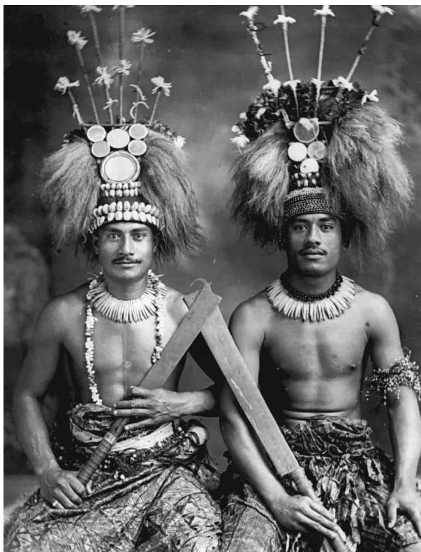
Abbildung 5: »Eingeborene« (o.J.)