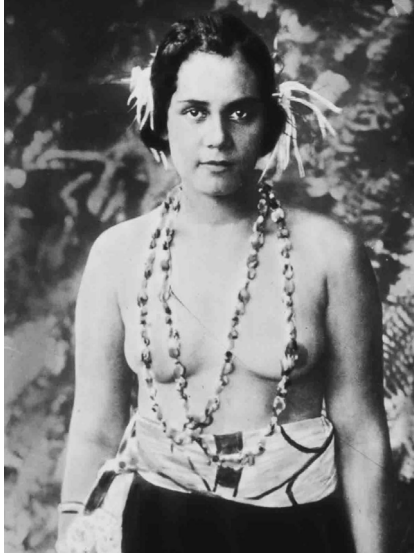
Abbildung 2: Thomas Andrew: »Aktstudie« (um 1905) aus: Tonin 2002, 208