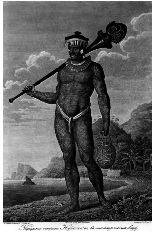
Abb. 1: Ein tätowierter Polynesier aus Nuku Hiva (Marquesas-Inseln) in klassizistischer Pose (aus Govor 2005: 59).

Lanze ( dory ) 3 durch eine große, beidhändig geführte Holzkeule ersetzt. In Analogie zum Begriff “Doryphoros” kann man hier von einem “Rhopalophoros” sprechen. Der abgebildete Inselbewohner hält zudem in der linken Hand ein Netz, in dem sich möglicherweise eine Kalebasse befindet, während beim griechischen Original der rechte Arm frei herabhängt und dabei untätig ist. Die schwere Keule ist beim tätowierten Polynesier aufgeschultert, während beim Doryphoros, der einem allgemeinen Konsens nach den griechischen Helden Achill darstellt, die Waffe nicht direkt auf seiner Schulter lastet, sondern frei gehalten wird (Hafner 1997: 46, 48; Kreikenbom 1993: 105).