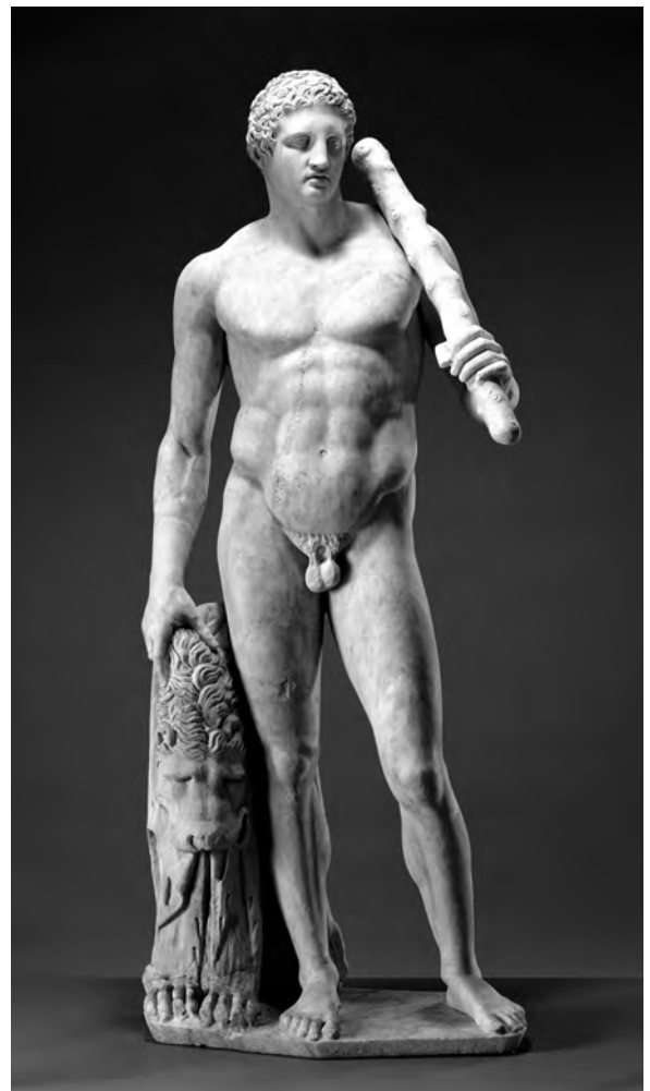
Abb. 3: Der in der Hadriansvilla gefundene Lansdowne Herakles.

über deren genaues Aussehen. Das aus Bronze gegossene Original Polykleitos ist nämlich bedauerlicherweise nicht erhalten geblieben, und eine 1797 in Pompeji gefundene römische Marmorkopie der Statue wurde erst 1862 – also viele Jahre nach der Veröffentlichung von Krusensterns Reisebericht – konkret als Polykleitos Doryphoros identifiziert (Hafner 1997: 19). Eine bildliche Rekonstruktion aus dem Jahr 1814 zeigt z. B. fälschlicherweise sogar einen Mann, der sich mit seiner rechten Hand auf einen Speer stützt, während die linke Hand einen am Boden stehenden Schild hält (Hafner 1997: 17–19). Allein aus diesem Grund kann es sich bei dem Kupferstich also keineswegs um eine bewusste Anlehnung an Polykleitos Statue handeln. Könnte aber ungeachtet dieses Sachverhalts hier dennoch eine Doryphoros-Rezeption vorliegen? Dies ist rein theoretisch zu bejahen, denn zum Zeitpunkt der Abfassung besagten Reiseberichts war ja bereits jene rö-