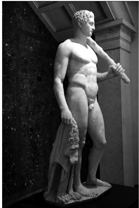
Abb. 4: Der Lansdowne Herakles von der Seite gesehen.

digenen. Es ist gerade dieses bestimmende Merkmal, das eine Verbindung zum Lansdowne Herakles wahrscheinlicher macht als zum Doryphoros, 8 da es sich sowohl beim Polynesier als auch bei Herakles thematisch gesehen jeweils um einen Rhopalophoros handelt.