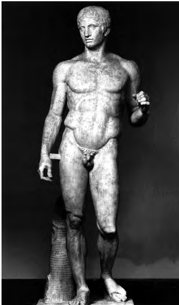
Abb. 2: Eine in Pompeji gefundene römische Marmorkopie von Polykleitos Doryphoros (aus Hafner 1997: Faltbild am Ende des Buches).

terschiedlich ausfallen. So sind schon aus der Antike Rezeptionen des Doryphoros bekannt, die hinsichtlich der Körperhaltung in manchen Punkten vom berühmten Vorbild stark abweichen. Als Beispiel könnte man die Panzerstatue des Augustus aus Primaporta nennen (Hafner 1997: 37 f.). Bisweilen kann das Original sogar nur als Inspirationsquelle für eine völlig freie Rezeption dienen. 4 Vom Standpunkt der Forschungsgeschichte zur griechischen Doryphoros-Statue muss allerdings zudem angemerkt werden, dass man zu Krusensterns Zeiten zwar durch antike Berichte Kenntnis von der Existenz der Statue hatte, 5 aber keine klare Vorstellung