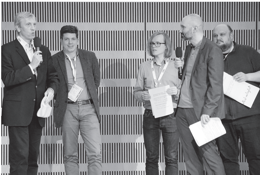
6 Im Resümee präsentierten die Verantwortlichen der einzelnen Sessions deren Diskussionsergebnisse

würde Wikidata, Wikipedia und Wikibase noch stärker von der Verlässlichkeit und den Strukturen rund um die GND profitieren und so seine Funktion als weltweites Datahub stützen.