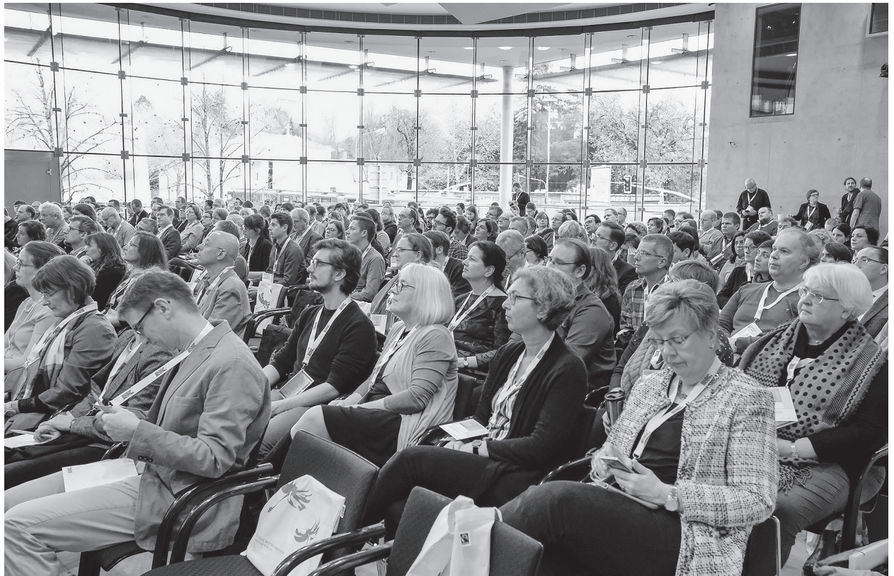
2 Blick ins Publikum der GNDCOn 2018

bis W wie Wikidata – beleuchteten das Thema aus verschiedenen Blickwinkeln.