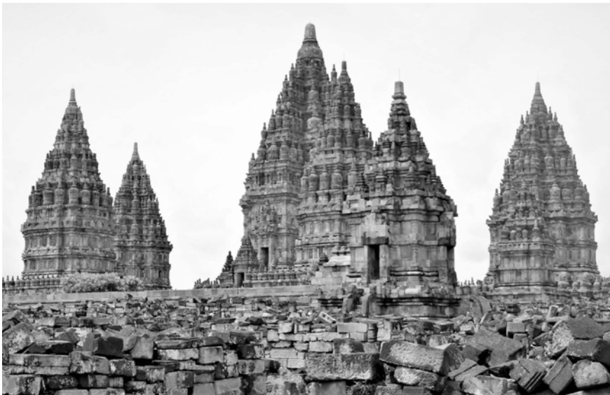
Abbildung 50: Prambanan vor den Toren von Yogyakarta

Die auf Java weithin bekannte Legende berichtet vom Krieg der beiden benachbarten Königreiche Pengging und Prambanan, in deren Verlauf es Pangeran Bondowoso gelingt, den König von Prambanan zu töten. Bei der Beisetzung des genannten Königs wird Bondowoso auf dessen schöne Tochter Roro Jonggrang aufmerksam und macht ihr einen Antrag. Sie willig nur vordergründig ein, will sie doch den Mörder ihres Vaters nicht heiraten, und stellt eine Bedingung: Sie ist bereit, seine Frau zu werden, wenn es ihm gelingt, die sprichwörtlich tausend Tempel, die mit der Tempelanlage Prambanan vor den Toren von Yogyakarta 12 in Verbindung gebracht werden, in einer einzigen Nacht zu errichten. Bondowoso macht sich sogleich an die Arbeit, und da ihn ein dienstbares Geisterheer bis tief in die Nacht hinein unterstützt, kommt er rasch voran. Als Jonggrang realisiert, dass Bondowoso dabei ist, die von ihr gestellt Bedingung zu erfüllen, greift sie zu einer List. Sie ordnet an, im Osten Heuballen zu entzünden. Als die hilfreichen Geister den erleuchteten Horizont erblicken, glauben sie, ein neuer Tag bricht an und eilen Hals über Kopf in ihr Reich zurück, ohne den letzten noch zu errichtenden Tempel fertigzustellen. Als Bondowoso bemerkt, dass er getäuscht wurde, verwandelt er Loro Jonggrang in Stein – die Standfigur einer Durga im Siva-Tempel von Prambanan gilt als ihr getreues Abbild.