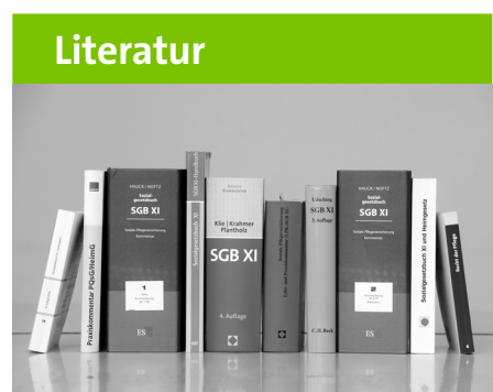
D&S Healthcareconsulting (2017): Pflegeheimbericht – Frankfurt am Main; D&S Healthcareconsulting, Frankfurt am Main.

Ein »TV Soziales« als vermeintliches Patentrezept für bessere Vergütungen ist somit als Irrweg für das Ziel einer finanziellen und gesellschaftlichen Aufwertung sozialer Berufe enttarnt. Die Debatte verhindert eine differenzierte Auseinandersetzung mit den tatsächlichen Arbeitsbedingungen bei kirchlichen, nicht tarifgebundenen und privatgewerblichen Wettbewerbern. Zum anderen wird die Politik aus ihrer Pflicht entbunden, Preisfindungssysteme für die sozialen Dienstleistungen weiterzuentwickeln und endlich eine ehrliche Debatte um Finanzierung von Sozialpolitik angesichts objektiven demographischen Herausforderungen zu führen. Flächendeckende Tarifwerke, wie bei der Diakonie und Caritas, soweit sie auf regionale und hilfeldspezifische Besonderheiten Rücksicht nehmen, sind der richtige Weg, die Attraktivität sozialer Berufe und die Vergütungen zu erhöhen. Im Wettbewerb um geeignetes Personal, können Dienstgeber und Dienstnehmer am besten gemeinsam und sachnah Bedürfnisse der Branche erfüllen. ■