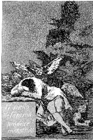
Abb. 2: Francisco de Goya: El sueño de la razón produce monstruos (Der Schlaf [Traum] der Vernunft gebiert Ungeheuer), um 1797–99, Capricho Nr. 43, Radierung, Madrid 32

Nach Jürgen Habermas hat gerade die erkenntnistheoretische Orientierung der neuzeitlichen Philosophie zur szientistischen Sichtweise beigetragen, dass „Wissenschaft nicht länger als eine Form möglicher Erkenntnis“ gilt, sondern es zu der Identifikation von „Erkenntnis mit Wissenschaft“ 33 kommt. Nur den als naturwissenschaftlich-objektiv verstandenen primären Qualitäten der Gegenstände im Sinne Galileo Galileis kommt objektive Realität zu, alle Wahrnehmungen und Empfindungen liegen als sekundäre Qualitäten allein im Subjekt. 34 Die Realität verengt sich auf das methodisch Nachweisbare, das streng genommen nur das Messbare ist. Daher das heute alle Forschung bestimmende und genau zutreffende – wiewohl fiktive – Zitat Galileis: „Wer naturwissenschaftliche Fragen ohne Hilfe der Mathematik lösen will, unternimmt Undurchführbares. Man muss messen, was messbar ist, messbar machen, was es nicht ist.“ 35 Wie Max Horkheimer in seiner grundlegenden Abhandlung über die instrumentelle