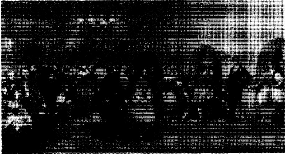
Abb. 1: Foyer de la Danse der Pariser Opéra, Ölgemälde von Eugène Lami, um 1840