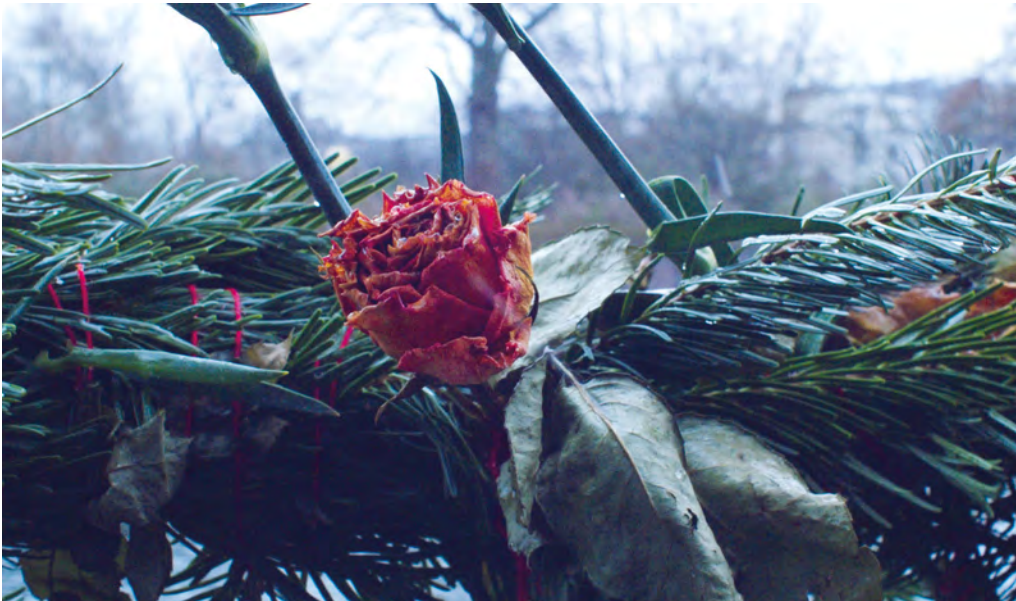
Abb. 1–9 Ghassan Salhab: Une rose ouverte / Warda , 2019, Filmstills