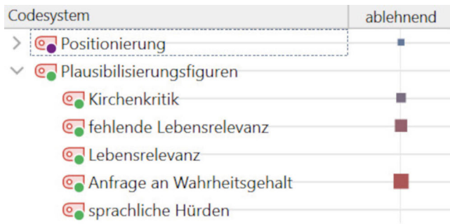
Abb. 4: Code-Relations-Browser

Folglich ergeben sich zum Beispiel markante Punkte in der Schnittmenge von ablehnender Haltung (vgl. Kategorie Positionierung ) und Anfrage an den Wahrheitsgehalt sowie fehlender Lebensrelevanz und Kirchenkritik (vgl. Kategorie Plausibilisierungsfiguren ). Weniger ausgeprägt sind dagegen Zusammenhänge zwischen ablehnender Haltung und den Subkategorien Lebensrelevanz sowie sprachliche Hürden .