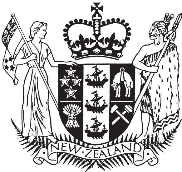
Abb. 4: Das Wappen Neuseelands (aus Hüttermann 1991: 91).

sich somit geschlossen hinter zwei Flaggen, die in ihrer Symbolik auf zwei Völker mit unterschiedlicher Geschichte und Kultur rekurren. Durch dieses Bild wird angedeutet, dass man gewillt ist die Zukunft des Landes gemeinsam zu gestalten.