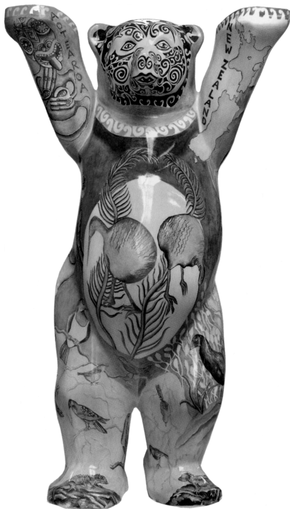
Abb. 2: Die Vorderseite des neuseeländischen "Buddy Bear" (aus Herlitz und Herlitz 2006: 185).