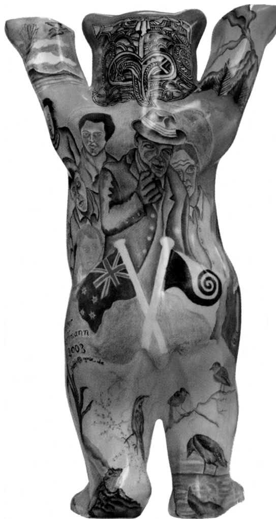
Abb. 3: Die Rückseite des neuseeländischen "Buddy Bear" (aus Herlitz und Herlitz 2006: 184).

terkopf des Bären auf Abbildungen von realen Artefakten als Vorlage zurückgegriffen hat, war dies bei der Tätowierung erfreulicherweise nicht der Fall, denn dies hätte eine sehr große Taktlosigkeit dargestellt. Bei den Maori ist nämlich die Gesichtstätowierung untrennbar mit der Identität jener Person verbunden, die sie trägt. Daher konnten die Indigenen Neuseelands auf Verträgen Nachbildungen ihrer Gesichtstätowierung als bindende Unterschrift verwenden (Schifko 2005: 182). Die Tätowierungen haben nicht nur in der Vergangenheit eine große Bedeutung gehabt, sondern rücken auch heutzutage im Zuge einer Renaissance wieder in den Vordergrund, und man betrachtet sie geradezu als Verkörperung der Maori-Kultur (Gathercole 1988: 175; Schifko 2007: 562).