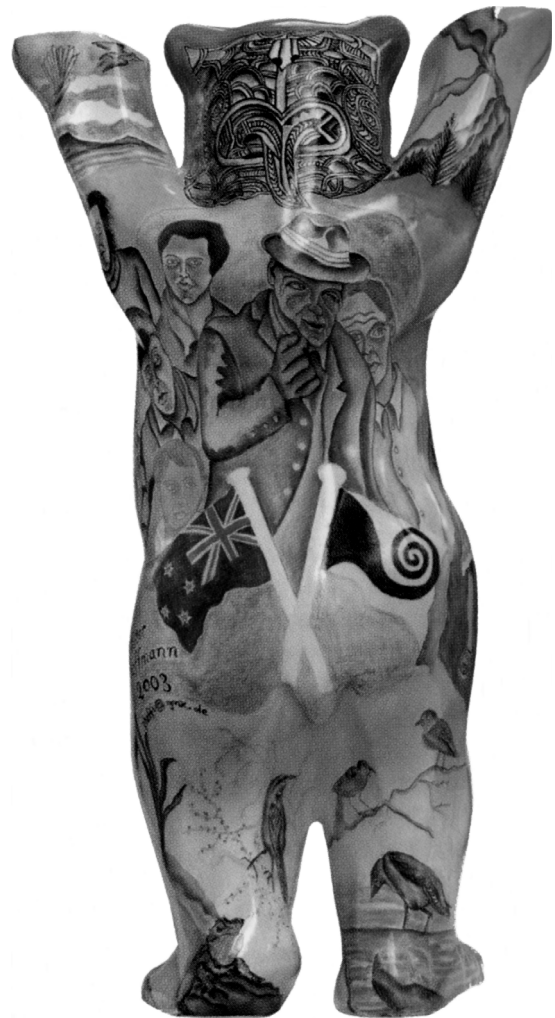
Abb. 3: Die Rückseite des neuseeländischen "Buddy Bear" (aus Herlitz und Herlitz 2006: 184).

terkopf des Bären auf Abbildungen von realen Artefakten als Vorlage zurückgegriffen hat, war dies bei der Tätowierung erfreulicherweise nicht der Fall, denn dies hätte eine sehr große Taktlosigkeit dargestellt. Bei den Maori ist nämlich die Gesichtstätowierung untrennbar mit der Identität jener Person verbunden, die sie trägt. Daher konnten die Indigenen Neuseelands auf Verträgen Nachbildungen ihrer Gesichtstätowierung als bindende Unterschrift verwenden (Schifko 2005: 182). Die Tätowierungen haben nicht nur in der Vergangenheit eine große Bedeutung gehabt, sondern rücken auch heutzutage im Zuge einer Renaissance wieder in den Vordergrund, und man betrachtet sie geradezu als Verkörperung der Maori-Kultur (Gathercole 1988: 175; Schifko 2007: 562).