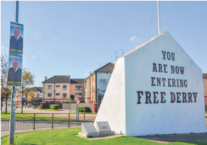
Abb. 4: Gedenkort Free Derry Corner in Derry (Nordirland), Foto 2011.