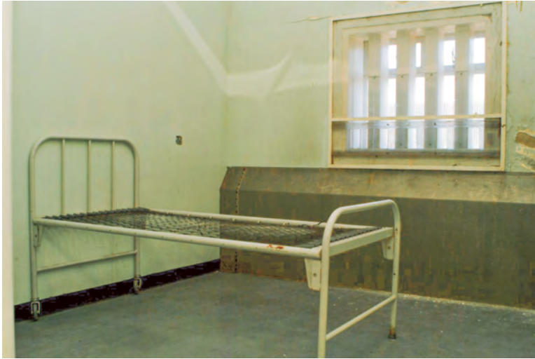
Abb. 3: Gefängnis Long Kesh/Maze bei Lisburn (Nordirland). Zelle von Bobby Sands im Krankenhaustrakt der H-Blocks, Foto 2004.

die Ruinen inzwischen für die Öffentlichkeit geschlossen, doch war McAtackney in der Lage, sie während ihrer Feldforschung noch zu besuchen. Über diese Erfahrung schreibt sie: