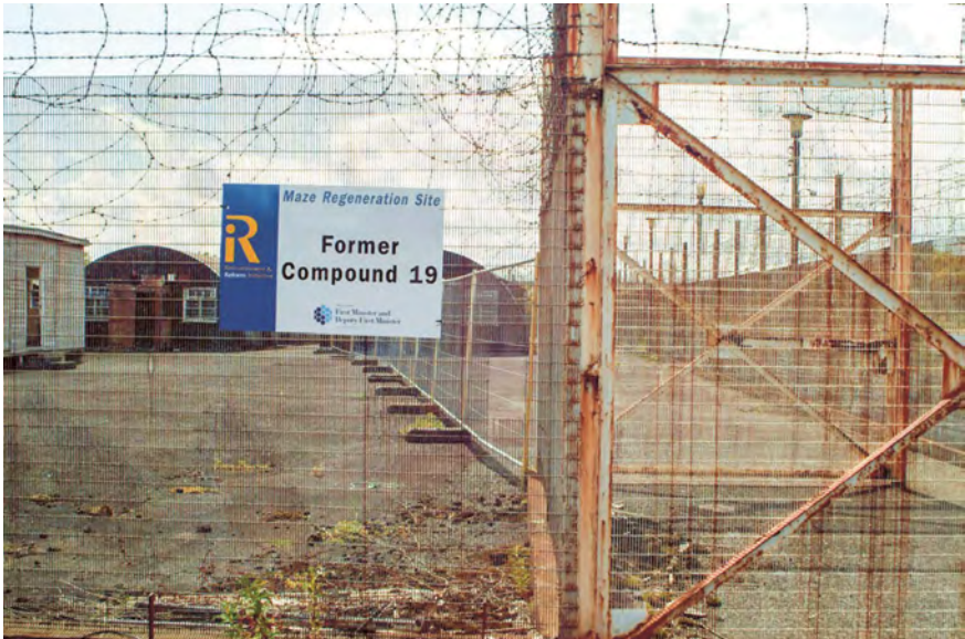
Abb. 1: Compound 19 des Internierungslagers Long Kesh bei Lisburn (Nordirland) nach der Schließung im September 2004, Foto 2004.

Soziologin Claire Mitchell bezeichnet die Religionszugehörigkeit in Nordirland als »ethnische Markierung«. 12