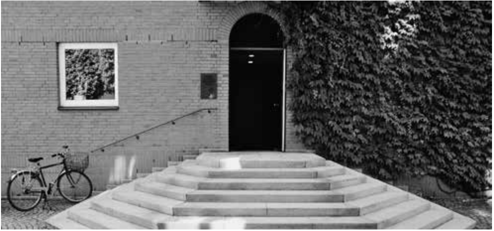
Fahrrad des Verlegers vor dem Verlagsgebäude in der Ainmillerstraße 12