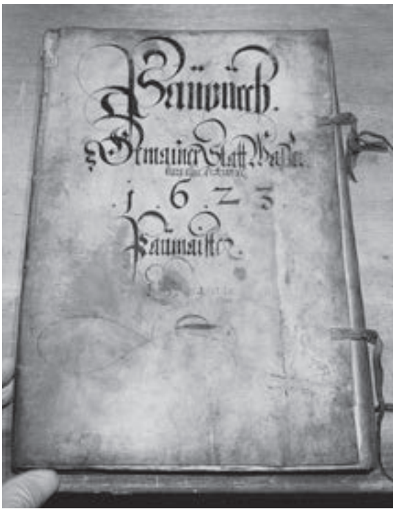
Abb. 1: Das Baubuch der Stadt Wasserburg von 1623 im Zustand vor Restaurierung aus dem Stadtarchiv Wasserburg a. Inn – ein Handschriftenband aus dem Alten Archiv der Stadt im Rathaus, Kommunalarchiv